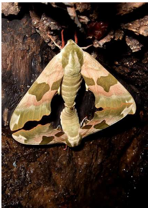
Mimas tiliae , Clisson (P. Ouvrard)

Et enfin, pour clore ce « chapitre » lépidoptérologique, voici un retour sur quelques observations de « nocturnes » marquantes : PO et AR ont observé le 13/07 un accouplement de Mimas tiliae (Sphinx du Tilleul) sur les bords de Sèvre à Clisson. Cette même espèce est attirée à la lampe, ainsi que Deilephila elpenor (Grand Sphinx de la vigne) et Sphinx pinastri (Sphinx du pin) à Sautron par CH le 15/07. Une chenille de D. elpenor est trouvée le 11/07 à Port-Saint-Père par PT. DC mentionne Agrius convolvuli (Sphinx du liseron) dans l'un de ces messages relatifs à diverses observations entomologiques le 14/08 dans le secteur de Legé. Un Sphinx ligustri (Sphinx du troène) est observé le 23/07 à Boussay (PT).