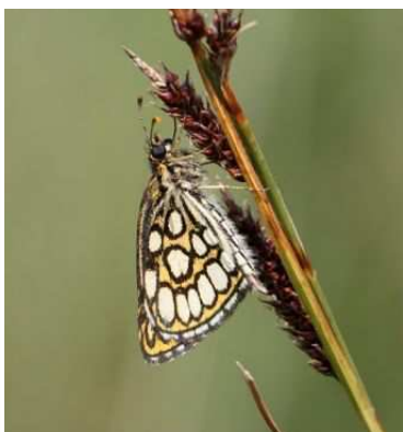
Heteropterus morpheus , Forêt du Gâvre (B. Livoir)