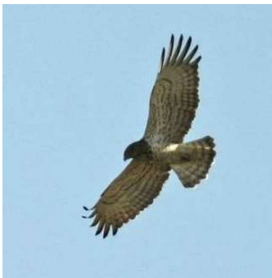
Circaète-Jean-le-Blanc, Bourgneuf-en-Retz (C. Lehy)

Quelques données de Torcol fourmilier avec un individu le 21/08 à Saint-Joachim (VB), 1 le 22/08 au Marais de Pompas (AG), 1 le 26/08 à la Petite Grée, Fercé (DG), probablement 2 individus près de Lyanne le 28/08 (DC), 1 ce même jour à la Bosse, Plessé (SB) et un autre à Grée, Ancenis (PB), 1 le 29/08 au Platin du Fort, Préfailles (RB), 1 mort le 29/08 à Sautron (AB) et 14 bagués à Grand-Lieu entre le 21 et le 29/08 (SR, AM, YB, DC, WR). Observation le 23/07 d'un Pouillot de Bonelli * à la Bondre de la Paroisse, Guérande (WM). Mauvaise année pour le Phragmite aquatique avec un nombre très faible de captures, ainsi, seul un oiseau a été capturé et bagué au Lac de Grand-Lieu en août contre 55 en 2012 sur ce même site (SR). Capture et baguage remarquable d'une Rousserolle verderolle * de première année le 21/08 au Lac de Grand-Lieu constituant la première mention de l'espèce sur le Lac (SR, AM, EA, AO, DA). Une Hypolaïs icterine * a été capturée et baguée le 22/08 au Marais de Pompas, Herbignac (AG). Deux Panures à moustaches se trouvaient le 1/07 et 5 le 21/07 au Marais de Pompas, Herbignac (Anonyme) et 1 le 7/06 au Marais de Mézérac, Saint-Lyphard (JMV). Un Bec-croisé des sapins le 6/07 au Bas-Rougerand, Saint-Vincent-des-Landes (WR) et 1 le 9/07 à Bourru, Saint-Vincent-des-Landes (WR).