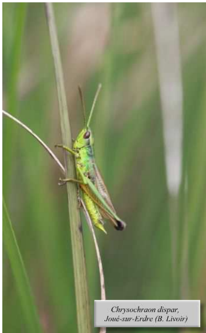
Chrysochraon dispar, Joué-sur-Erdre