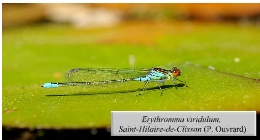
Erythromma viridulum , Saint-Hilaire-de-Clisson (P. Ouvrard)