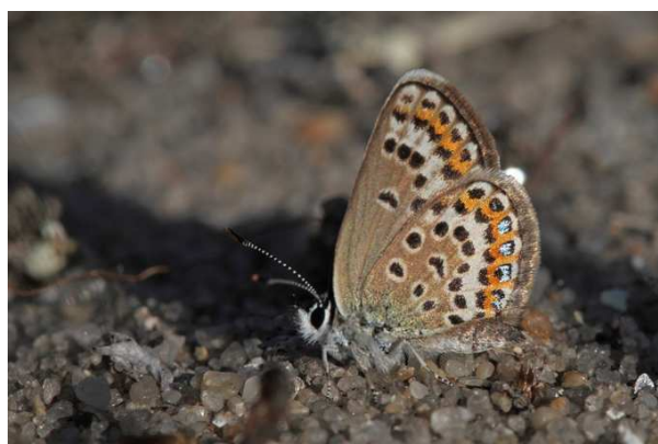
Plebejus argus , Guérande (J.-P. Tilly)

Parmi les lycènes remarquables, JPT nous signale une vingtaine de Plebejus argus (Azuré de l'Ajonc) le 9/08 à Guérande, alors que son petit cousin Plebejus idas (Azuré du Genêt) et observé le 6/08 sur un site déjà bien connu à Nozay par JM et YB. Maculinea alcon (Azuré des Mouillères), protégé au plan national, et inféodé à la Gentiane pneumonanthe et à une relation symbiotique avec des fourmis est observé au Gâvre par BL le 5/07. Il s'agit de la dernière population connue du département, et qui fait l'objet d'un suivi et d'une gestion particulière. Lampides boeticus (Azuré porte-queue) est une espèce méridionale, observée chez nous lors d'invasions ponctuelles par été chaud : le 31/07 à Petit-Auverné (TC), 1 couple à la Montagne les 4 et 31/08 (AO), 1 mâle le 10/08 à Boussay (PT) et le 11/08 à Pornic (LG). BB a vu et photographié Satyrrium ilicis (Thécla de l'Yeuse) à Saint-Aubin-des-Châteaux le 8/07, et le discret Thecla betulae (Thécla du bouleau) est vu et photographié le 10/08 à Assérac par JPT.