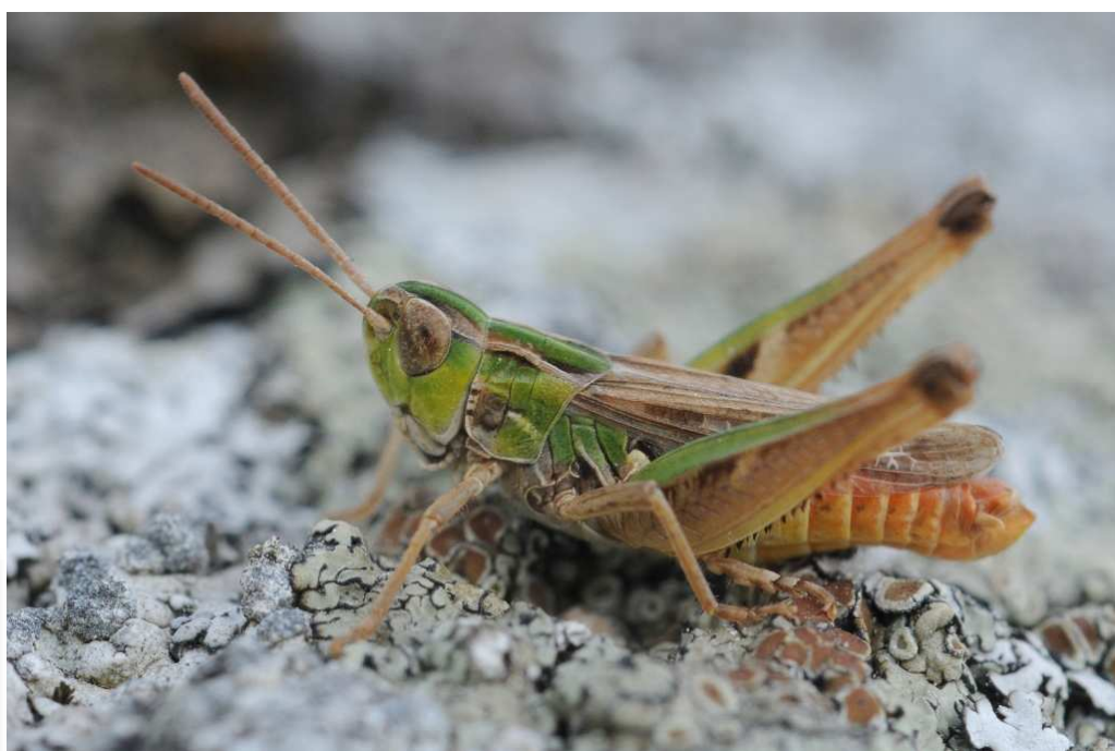
Stenobothrus stigmaticus , Boussay (P. Trécul)