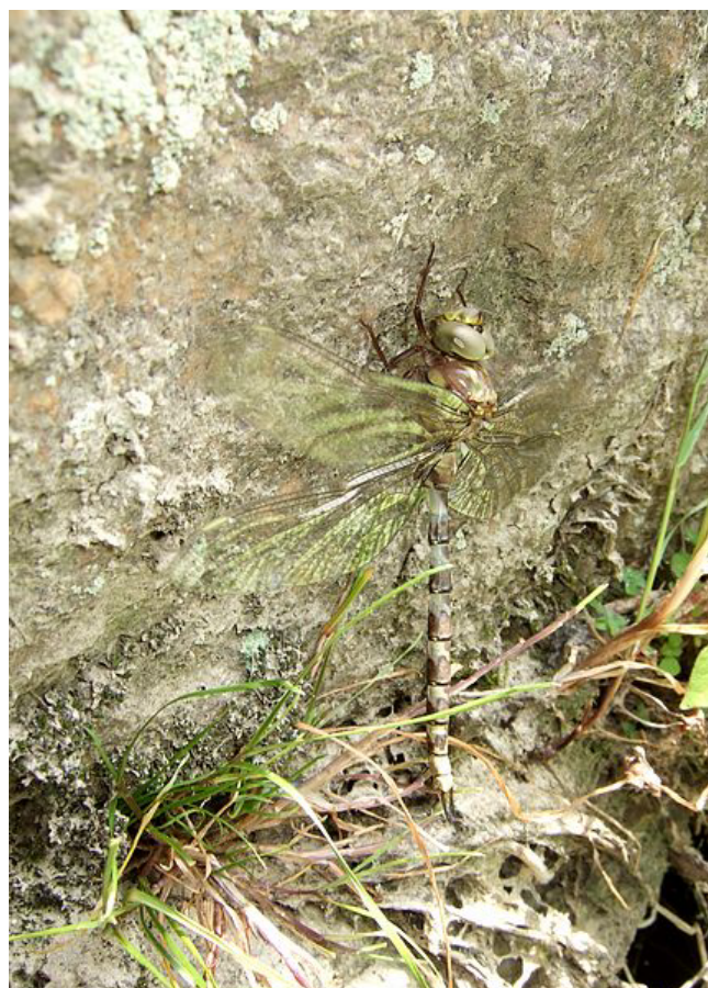
Boyeria irene , Boussay

Anax parthenope (Anax napolitain) a été vu (plusieurs individus) à Arthon-en-Retz le 8/07 par JV et régulièrement en juillet sur le lac de Grand-Lieu (SR).