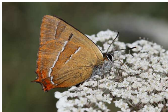
Thecla betulae , Assérac (J.-P. Tilly)