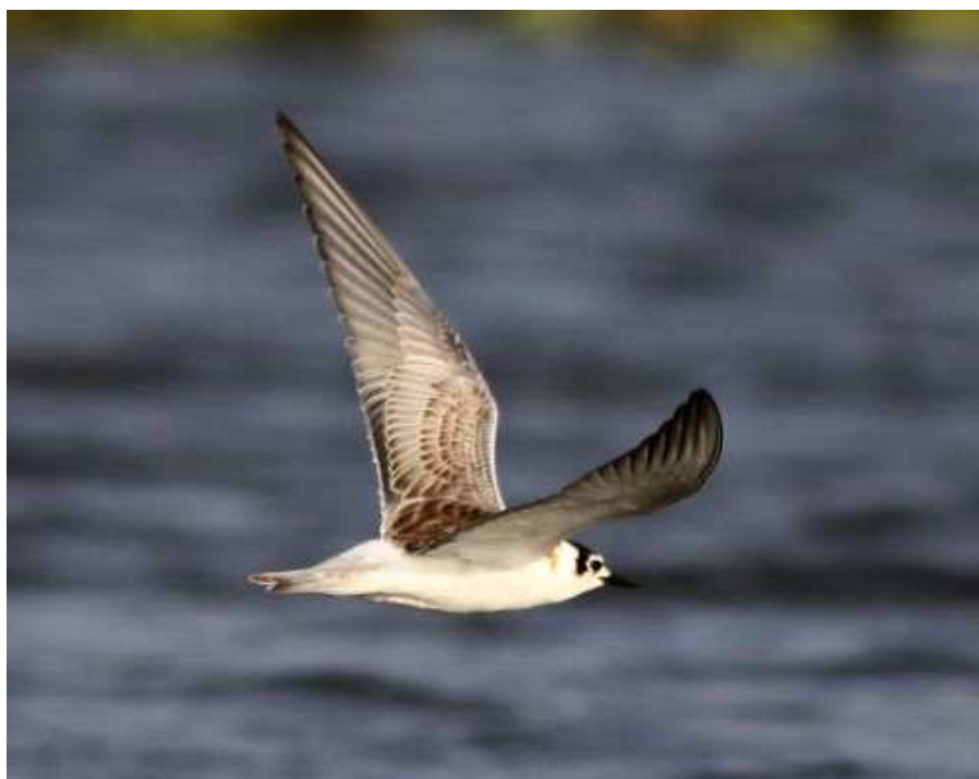
Guifette leucoptère, Grand-Lieu