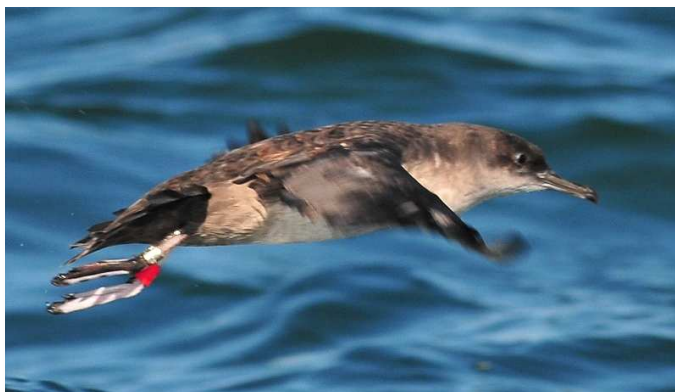
Puffin des Baléares bagué, Estuaire de la Vilaine (ci-dessus) et Puffin fuligineux, au large de l'île Dumet (J.-L. Dourin)

Ndlr : Cette rubrique reprend les observations récentes d'oiseaux en Loire-Atlantique, parvenues au GNLA par le biais du forum électronique et de la base de saisie en ligne « faune-Loire-Atlantique » à laquelle le GNLA contribue. Les données marquées d'astérisques sont mentionnées sous réserve d'homologation régionale (*) ou nationale (**).