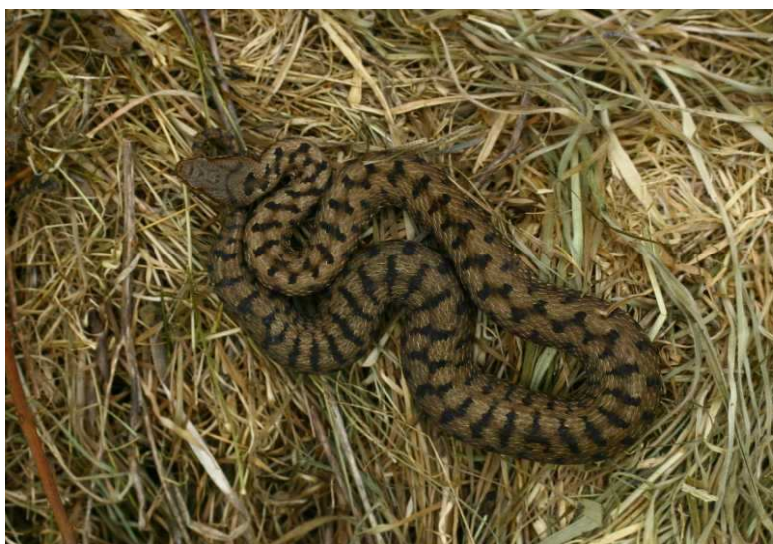
Vipère aspic en thermorégulation (C. Martin)

et al.). Tous les lézards présents en Loire-Atlantique sont mentionnés pour cette période (Juillet-Août 2013). On ne détaillera pas les nombreuses observations de Lézard des murailles , réparties de façon homogène sur le département, ni encore celles du Lézard vert hormis celle d'un chanceux, le 13/08 à Gourmalon à Pornic (LG) qui échappa des dents acérées d'un chat. La période automnale se prête moins, a priori , à l'observation des reptiles. Cependant, certains profitent encore des belles journées pour sortir se chauffer au soleil. Alors, l'oeil vif et les sens en éveil, une invitation à longer les haies, le bord des cours d'eau est lancée !