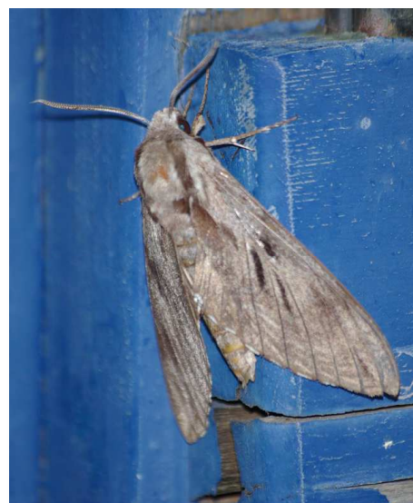
Sphinx pinastri , Sautron (C. Houalet)

Et enfin, pour clore ce « chapitre » lépidoptérologique, voici un retour sur quelques observations de « nocturnes » marquantes : PO et AR ont observé le 13/07 un accouplement de Mimas tiliae (Sphinx du Tilleul) sur les bords de Sèvre à Clisson. Cette même espèce est attirée à la lampe, ainsi que Deilephila elpenor (Grand Sphinx de la vigne) et Sphinx pinastri (Sphinx du pin) à Sautron par CH le 15/07. Une chenille de D. elpenor est trouvée le 11/07 à Port-Saint-Père par PT. DC mentionne Agrius convolvuli (Sphinx du liseron) dans l'un de ces messages relatifs à diverses observations entomologiques le 14/08 dans le secteur de Legé. Un Sphinx ligustri (Sphinx du troène) est observé le 23/07 à Boussay (PT).