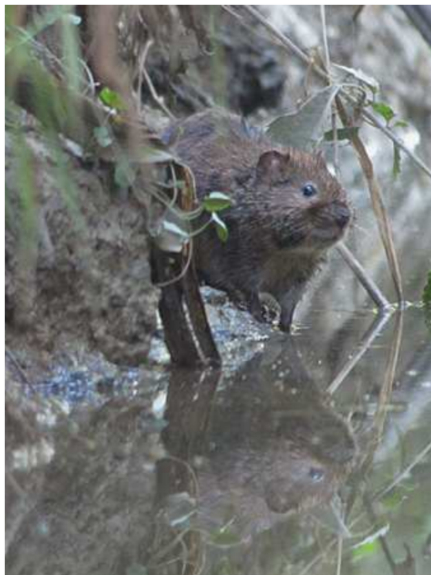
Campagnol amphibie, Rezé