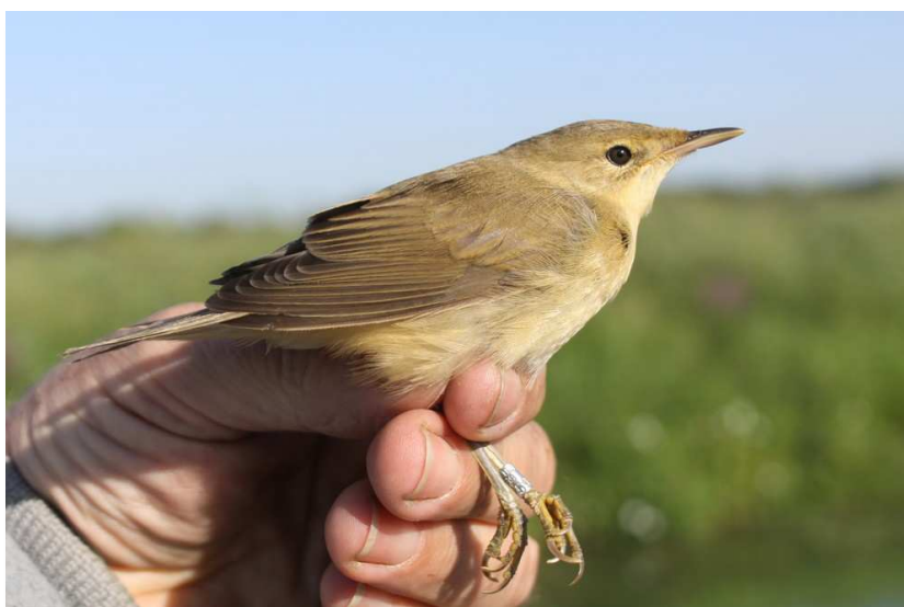
Rousserolle verderolle, Grand-Lieu