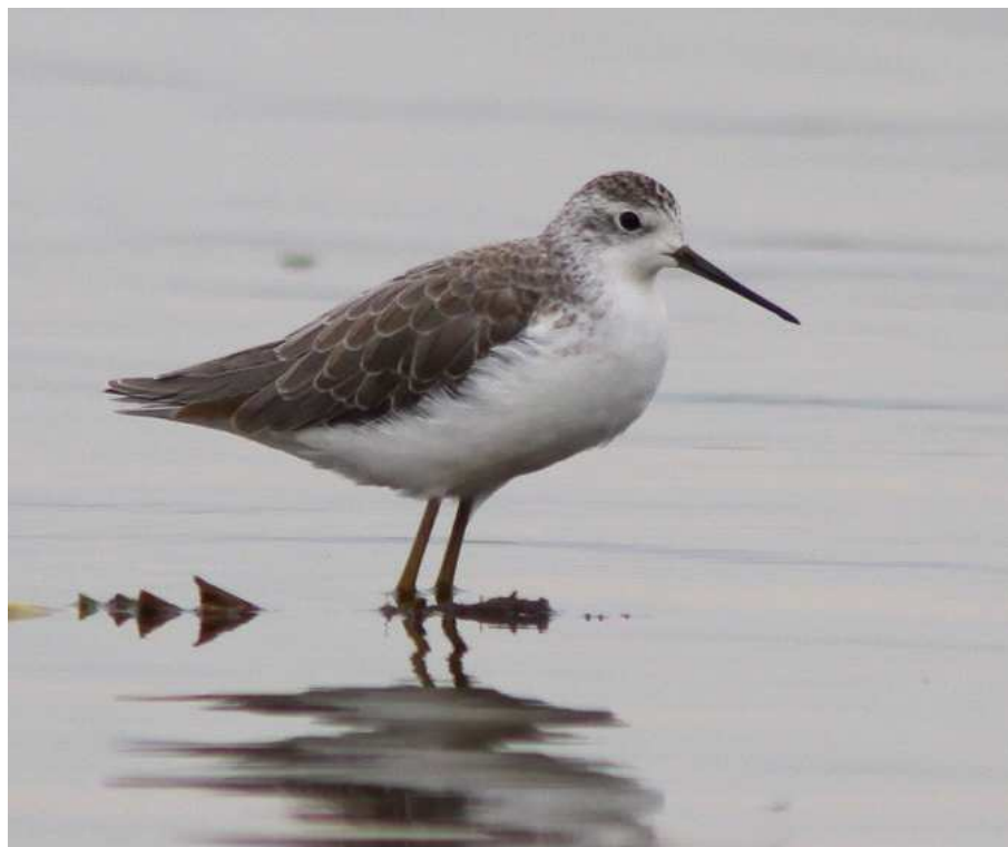
Chevalier stagnatile, Grand-Lieu