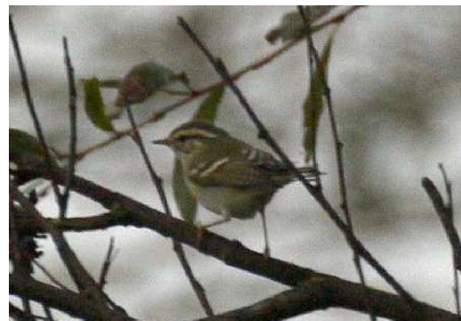
Pouillot à grands sourcils, Donges