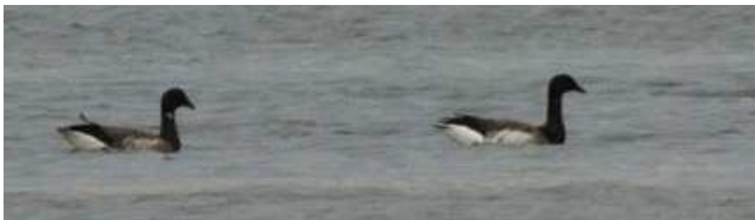
Bernache cravant à ventre pâle adulte (à droite), Mesquer (J.-M. Vailhen)