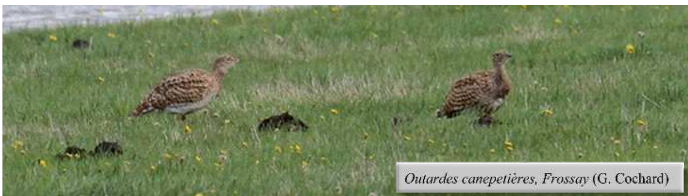
Outardes canepetières, Frossay (G. Cochard)