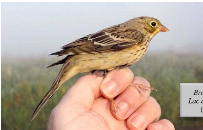
Bruant ortolan, Lac de Grand-Lieu (S. Reeber)