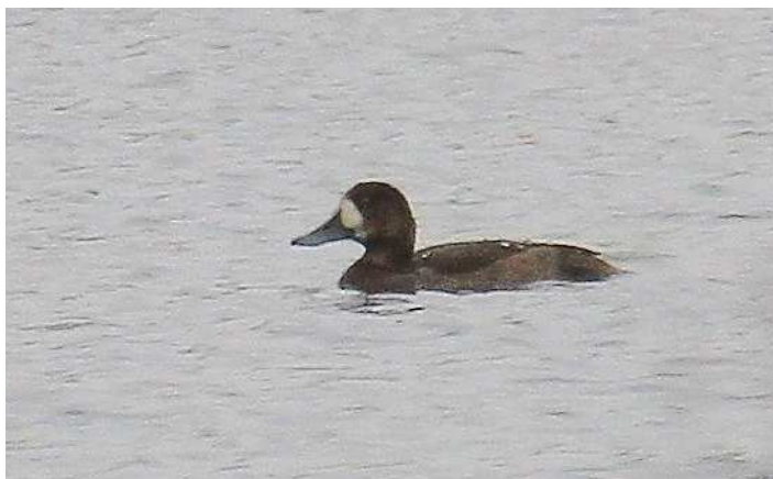
Fuligule milouinan Frossay (G. Cochard)