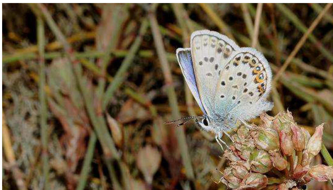
Plebejus argus (O. Vanucci)