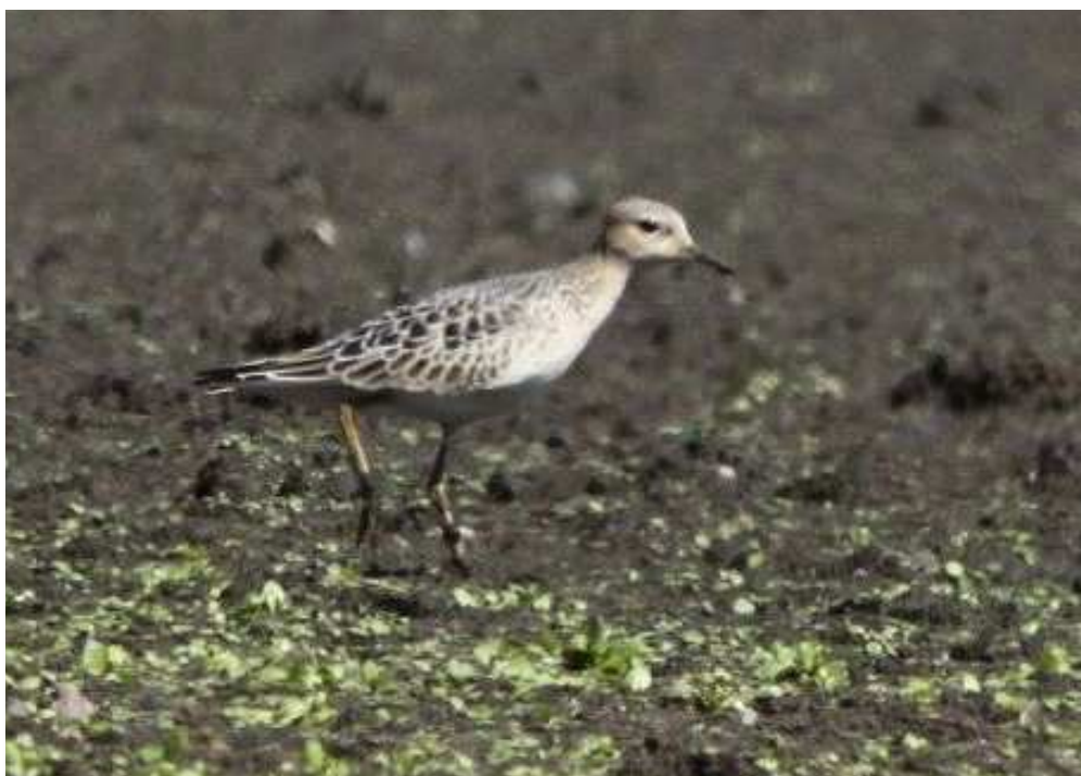
Bécasseau roussel, Grand-Lieu (S. Reeber)