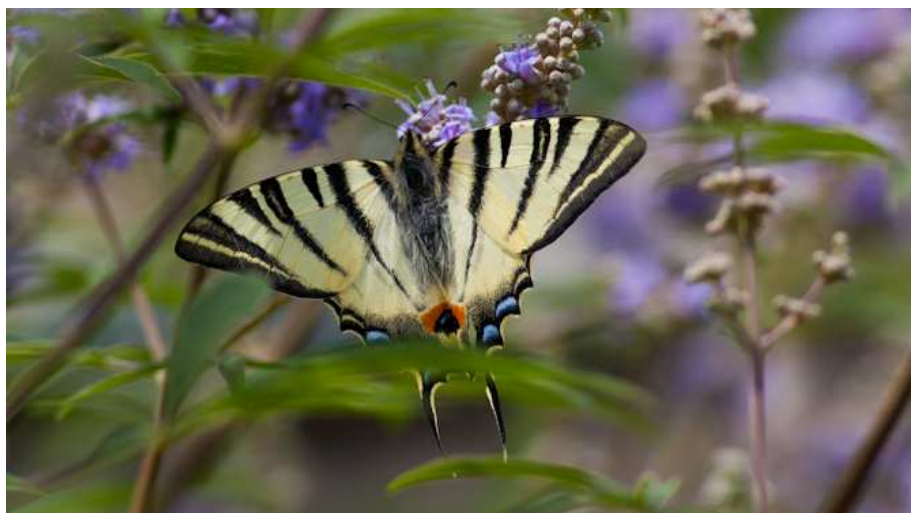
Iphiclides podalirius (P. Bellion)

Hipparchia semele (Agreste) : Au minimum 5 individus observés au Nord-Est de l'hippodrome de Mespras le 19/07 (YB).