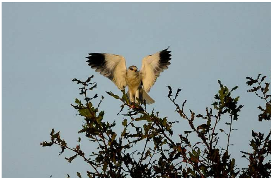
Elanion blanc, Saint-Hilaire-de-Clisson