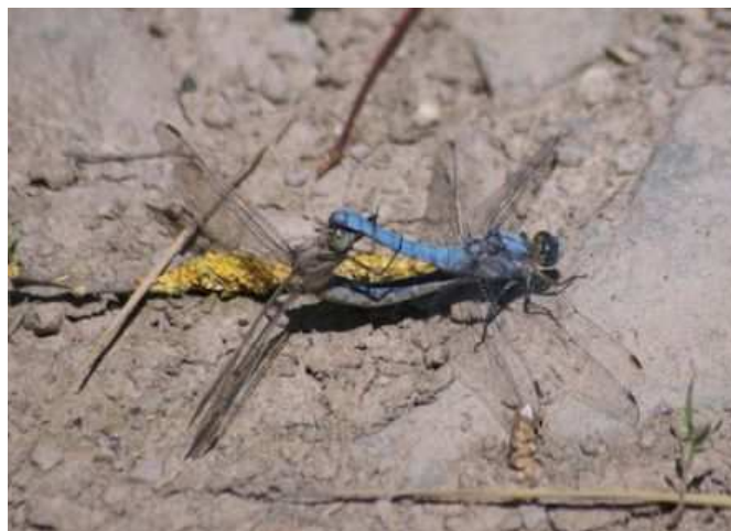
Orthetrum brunneum (V. Tanqueray)

Le nombre d'observations odonatologiques rapportées sur faune-loire-atlantique cette saison 2012 est véritablement très inférieur à celui de 2011. Pour les libellules, la météo exécrable a certainement eu un impact très néfaste pour les émergences. Quelques rares témoignages remarquables tout de même :