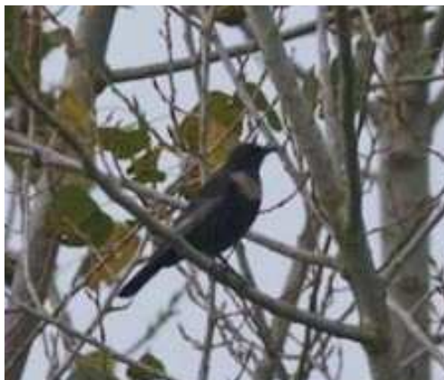
Merle à plastron, Ligné (V. Tanqueray)