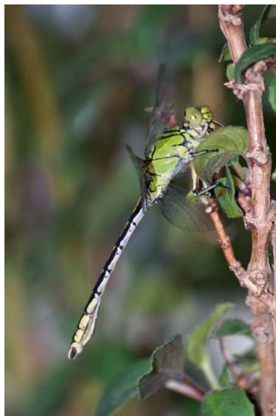
Ophiogomphus cecilia (V. Tanqueray)

Ischnura pumilio (Agrion nain) : Probablement la seule espèce à montrer des effectifs plus importants que les dernières années, l'Agrion nain a été signalé de quatre localités : Mauves-sur-Loire le 9/06 (PT), Rezé le 18/06 (AM), Sainte-Luce le 19/06 (AM), Saint-Etienne-de-Montluc le 31/07 (FR).