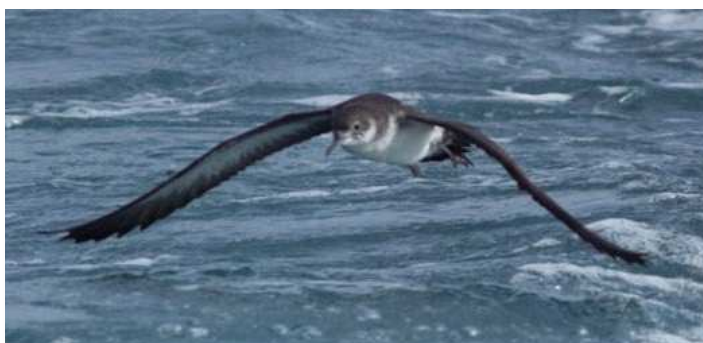
Puffin Yelkouan, au large de la Turballe

Ndlr : Cette rubrique reprend les observations récentes d'oiseaux en Loire-Atlantique, parvenues au GNLA par le biais du forum électronique et de la base de saisie en ligne « faune-Loire-Atlantique » à laquelle le GNLA contribue. Les données marquées d'astérisques sont mentionnées sous réserve d'homologation régionale (*) ou nationale (**).