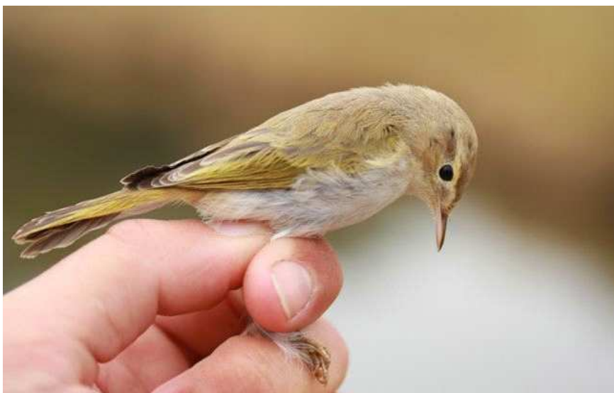
Pouillot de Bonelli, Les Moutiers-en-Retz (F. Latraube)