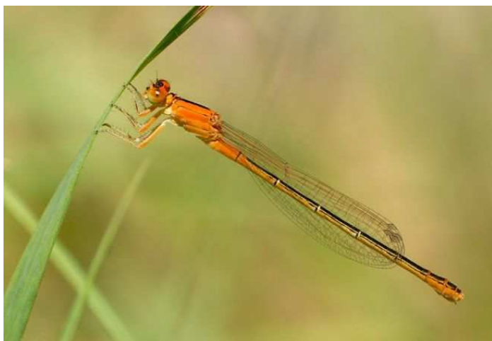
Ischnura pumilio (F. Roche)