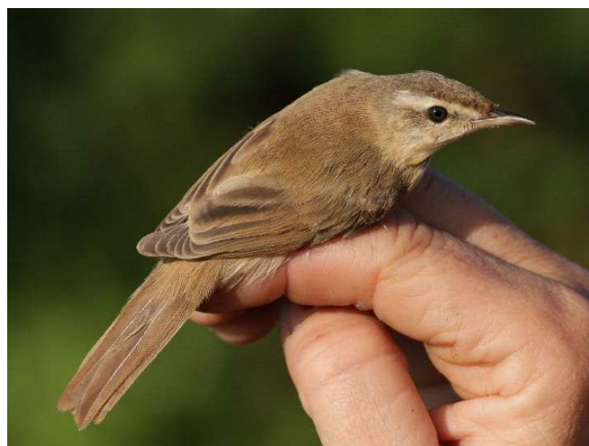
Rousserolle isabelle, Donges (E. Archer)