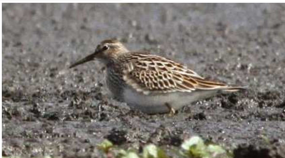
Bécasseau tacheté, Grand-Lieu