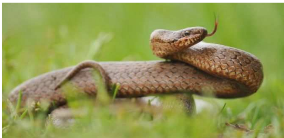
Coronelle lisse, Mouzillon (P.Trecul)

Un cadavre de Lézard vivipare a été découvert le 8/06 à Saint-André-des-Eaux (MGo), en pays briéron où l'espèce fut mentionnée pour la première fois dans le département par Thomas en 1860.