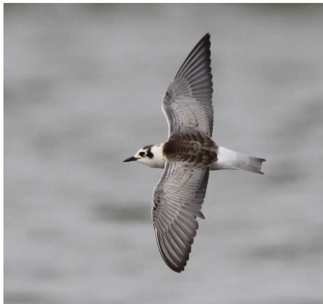
Guifette leucoptère, Grand-Lieu (S. Reeber)