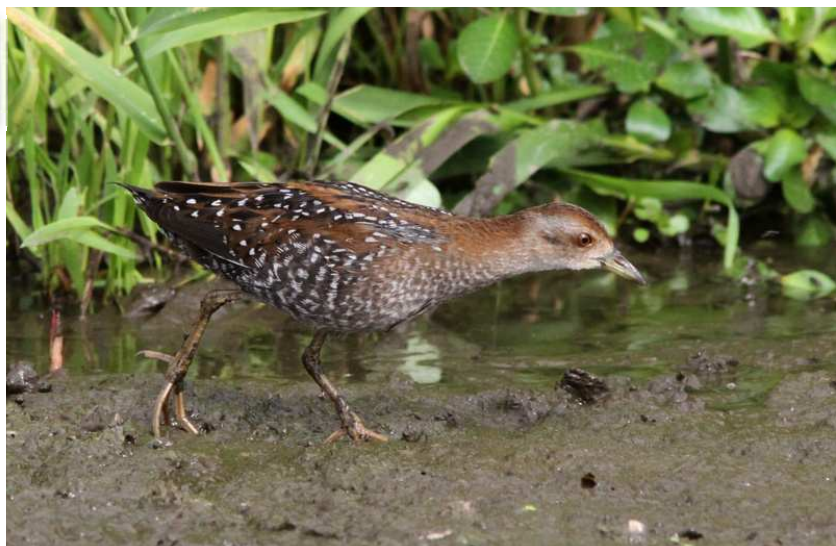
Marouette de Baillon, Grand-Lieu (S. Reeber)

Quelques données de Marouette ponctuée avec encore 1 chanteur le 8/07 à Liberge, Donges (JF) ; au Massereau, Frossay, plusieurs oiseaux ont été observés et pour certains bagués : 1 le 12/08 (FL), 1 observé le 15/08 (FL), 1 le 25/08 (FL, MB) et un dernier le 29/08 (FL). A Donges, stationnement d'un individu du 12/08 au 17/08 et ce dernier jour, présence également d'au moins un autre individu (CG). Concernant la Marouette de Baillon **, un nombre important