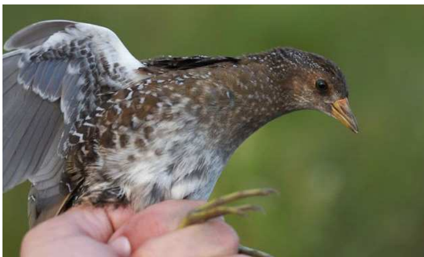
Marouette ponctuée juvénile (baguée), Frossay

le 30/08 (SR). Observation d'un Labbe pomarin le 31/07 à la Pointe du Croisic / Le Croisic (GC, CG). Stationnement classique à la fin-août d'une dizaine de Mouettes de Sabine dans l'estuaire de la Vilaine le 22/08 (JLD). Année compliquée pour la reproduction de la Sterne naine sur les grèves de Loire avec la reproduction certaine de seulement 2 à 3 couples à Varades (DD).