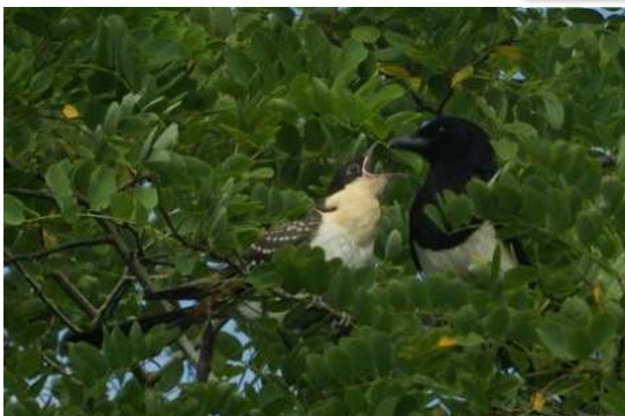
Coucou-geai juvénile nourri par une Pie bavarde, La Baule-Escoublac