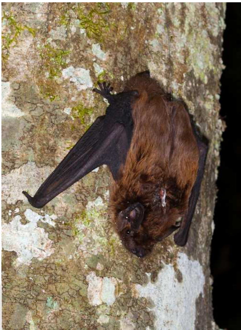
Noctule de Leisler équipée d'un émetteur, Forêt du Gâvre

Grand Murin : À Plessé le 4/07, 3 individus sont découverts dans une église (PhD). Durant l'étude en forêt du Gâvre, une femelle équipée a été retrouvée dans l'église de Guémené-Penfao, la colonie ne comptabilisait que 6 individus, une micro-colonie de plus pour le département. Le 23/08, 1 individu est enregistré à Varades (PB), le 25/08, 5 individus sont capturés à Trignac (NC, TR) et le 27/08, 1 individu est capturé à Sucé-sur-Erdre (LD & al).