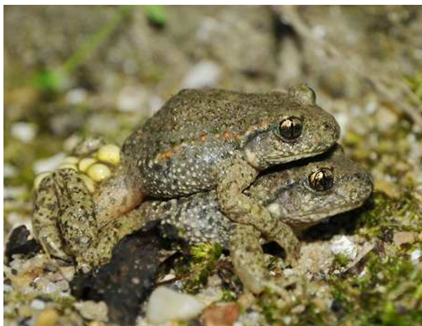
Alyte accoucheur, Boussay (P. Trecul)

Le Crapaud calamite a été observé le 1/05 à Oudon (VT), le 10/05 à Rezé (AV), et le 10/08 à Donges (CGi) sur des sites connus depuis plusieurs années pour abriter l'espèce.