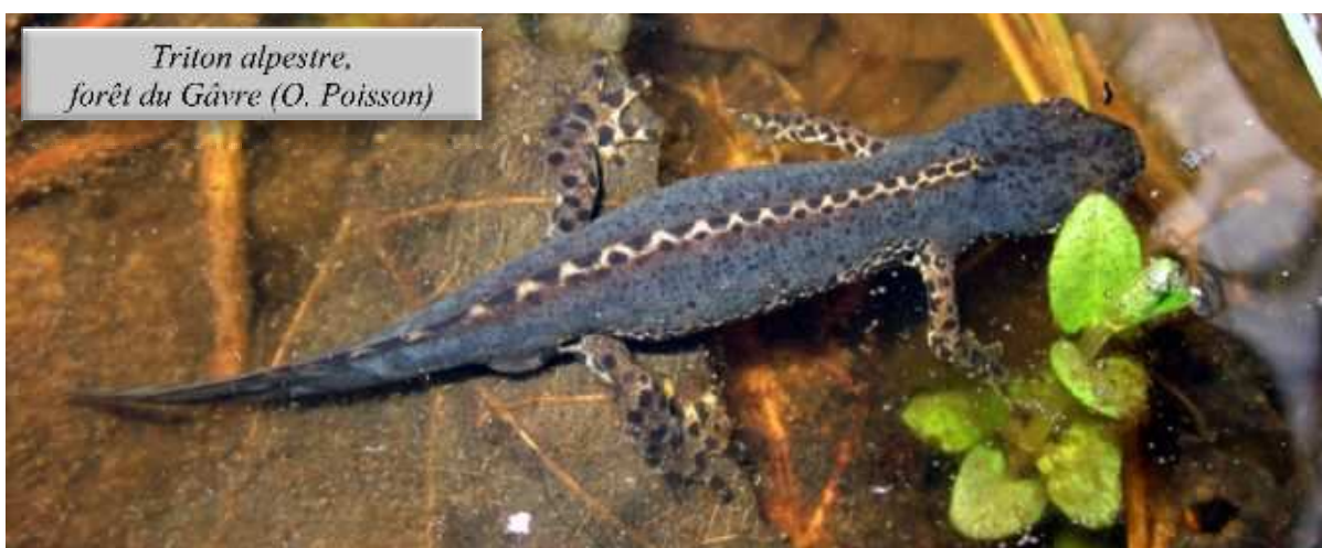
Triton alpestre, forêt du Gâvre (O. Poisson)

Signalons également les observations de mâles de Triton crêté encore en livrée nuptiale le 04/05 à Puceul (OP) et le 10/05 aux Sorinières (AV), et jusqu'en début juillet à Sainte-Reine-de-Bretagne (DM).