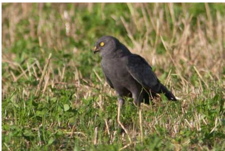
Busard cendré mâle adulte mélanique, Varades

Observation également d'un Milan royal le 14/07 à la Queteraie, Mésanger (MB). En dehors du bastion du Marais Breton, plusieurs observations de Busard cendré avec 1 mâle mélanique le 18/07 au Pot-aux-chiens, Varades (TH, PB) ; 1 mâle adulte le 2/08 au Bois Robert, Mésanger (MB) ; 1 le 17/08 à Donges (CG) ; 1 le 24/08 au Marais de Grée, Saint-Herblon (PB, BN) ; 1 le 26/08 à la Hardière, Mésanger (PB) ; 1 le 27/08 au Poirier à la Pie, Saint-Herblon (PB).