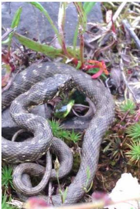
Couleuvre vipérine, Ancenis

Plusieurs observations intéressantes de serpents nous sont parvenues. Signalons tout d'abord l'observation de trois subadultes de Couleuvre verte et jaune le 13/05 à Gétigné (DA), espèce rare et localisée en Loire-Atlantique. Un subadulte de la même espèce a également été observé le 19/06 à Clisson (HB). Deux cadavres ont été retrouvés coincés entre les mailles d'un filet de protection de fraisiers le 02/07 à Boussay (PT), tandis qu'un autre individu victime de collision routière a été découvert le 03/07 à Saint-Hilaire-de-Clisson (SD).