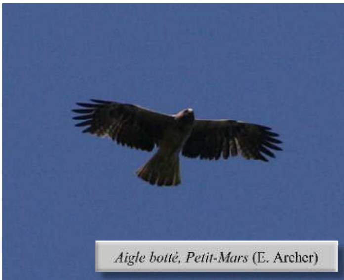
Aigle botté, Petit-Mars (E. Archer)

Guifette leucoptère * (Hors lac de Grand-Lieu) : 1 le 12/05 en Brière (JLD) et record pour le lac de Grand-Lieu avec la présence simultanée de 8 individus le 14/05 et encore 6 le 16/05 (SR) ; 1 le 27/05 aux Accrées, Saint-Philbert-de-Grand-Lieu (XH).