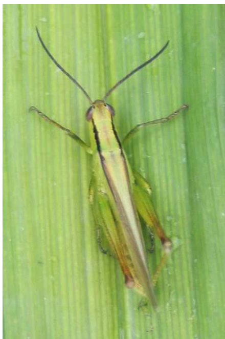
Mecosthetus parapleurus

Cette espèce toujours aussi discrète en Loire-Atlantique n'a été signalée qu'une seule fois du marais de Goulaine par FP le 18/08.