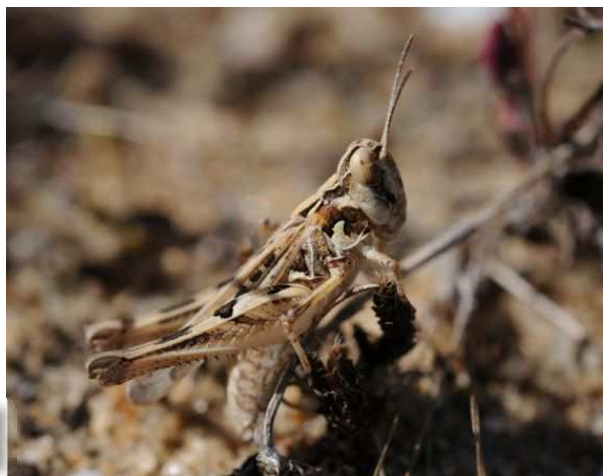
Doclostaurus jagoi (O. Vannucci)

Nos deux prospecteurs littoraux, OV et JPT, toujours eux, ont retrouvé cette petite espèce peu mentionnée depuis une petite dizaine d'année dans le département. Ils nous la signalent au Pouliguen et à Batz-sur-Mer le 24/07 lors de prospections communes, et ce avec des populations très importantes. OV la retrouvera sur de nouvelles localités au Pouliguen le 25/07 et à Batz sur Mer le 31/07.