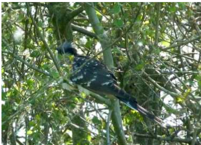
Coucou-geai, Guérande (S. Umhang)