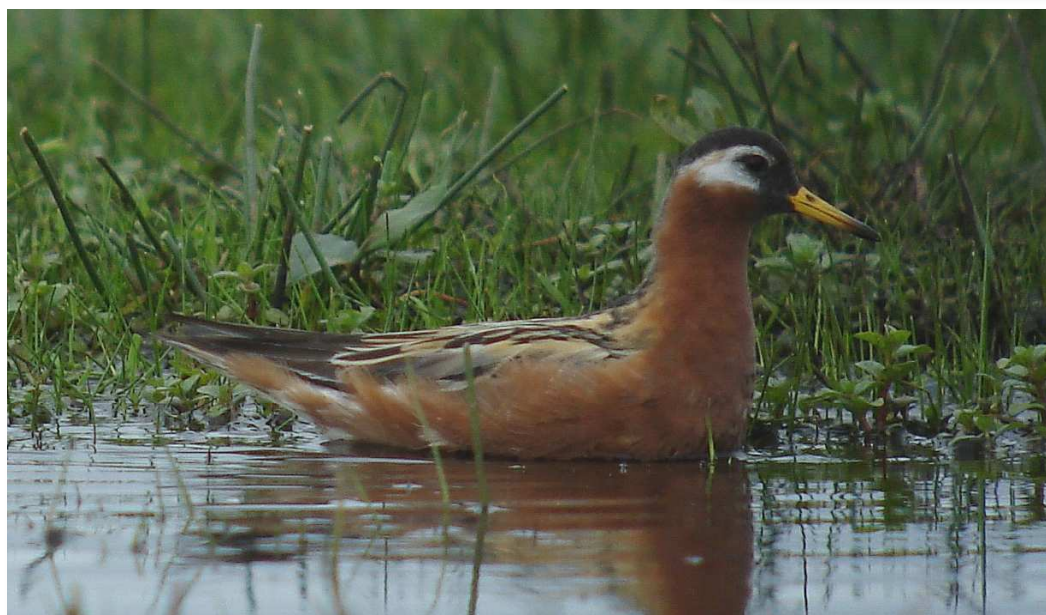
Phalarope à bec large, Brière