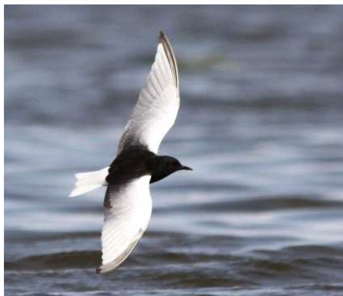
Guifette leucoptère, Grand-Lieu