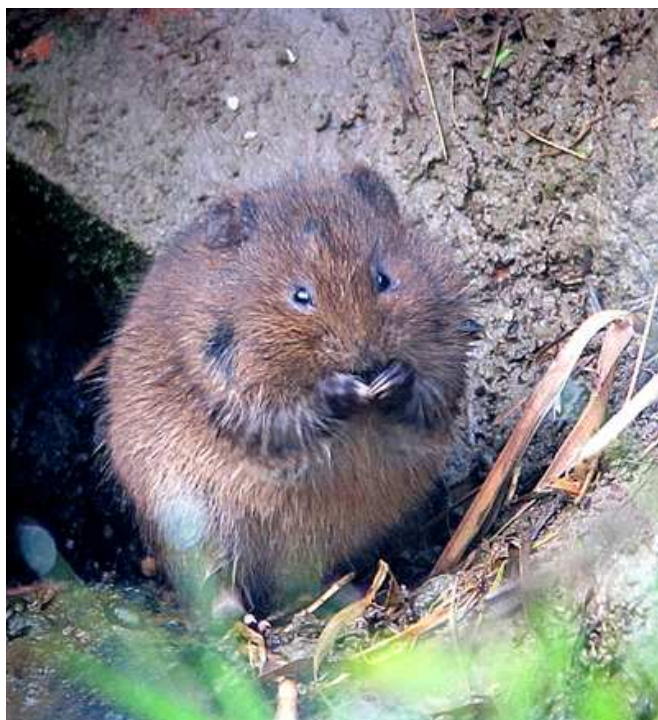
Campagnol amphibie, Rezé (P. Bourdain)