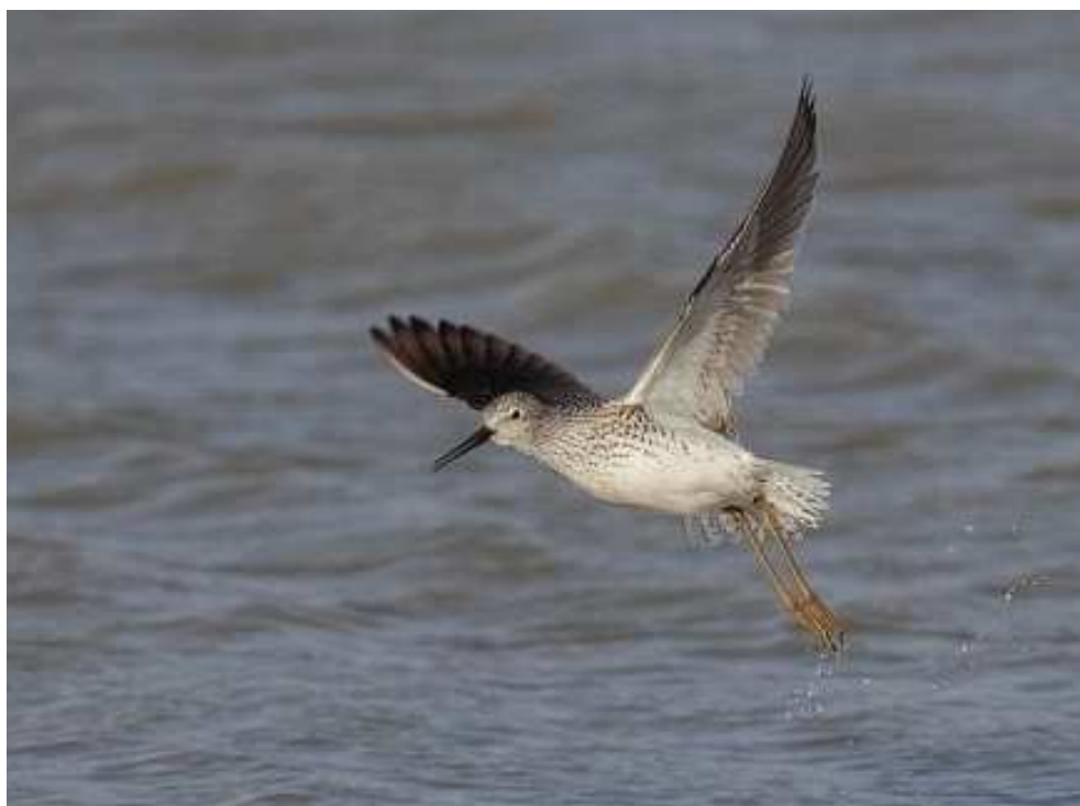
Chevalier stagnatile, Bourgneuf-en-Retz (C. Caiveau)

Butor étoilé : 1 à l'Étier de Beaulieu, Couëron le 18/03 (JLGi) ; 1 en vol le 23/03 au Landiart, Le Bignon (FP) ; 1 le 8/04 au Corbeau / Machecoul (DR).