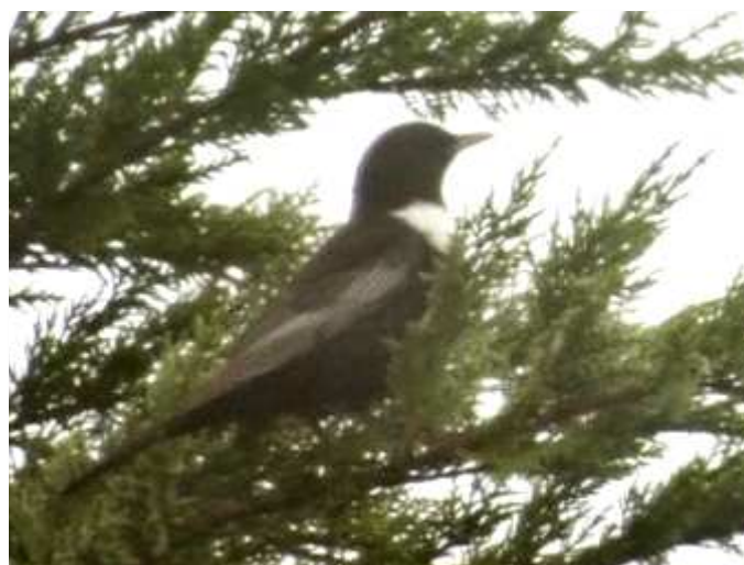
Merle à plastron ssp torquatus, Saint-Julien-de-Concelles (F. De Germain)

Pouillot siffleur : 2 chanteurs le 30/04 à la Meilleraye-de-Bretagne (PM).