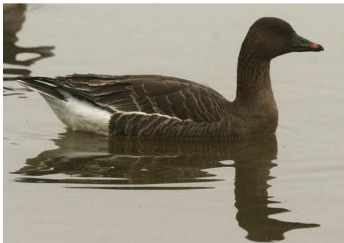
Oie de la Toundra, Saint-Viaud

Puffin des Anglais : 1 individu est observé suite à un coup de vent le 23/04 à la Pointe-du-Croisic, Le Croisic (OV).