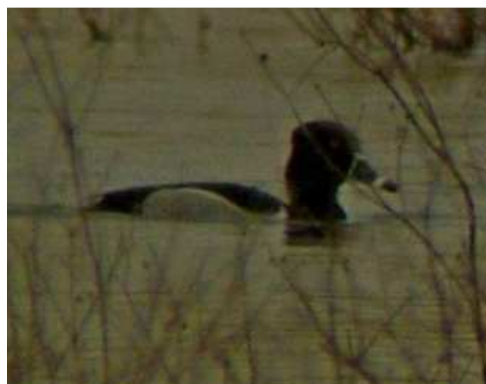
Fuligule à bec cerclé, Petit-Mars (D. Martineau)