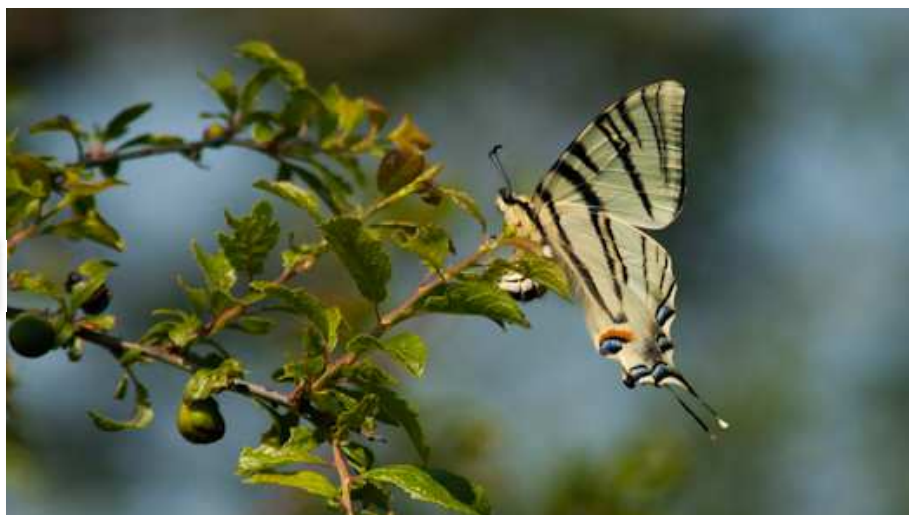
Iphiclides podalirius