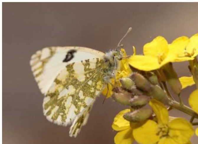
Euchloe crameri (W. Maillard)

Satyrrium ilicis (Thécla de l'Yeuse) : Noté le 26/05 à Saint-Mars-de-Coutais (LB) et le 31/05 à Couëron (CH).