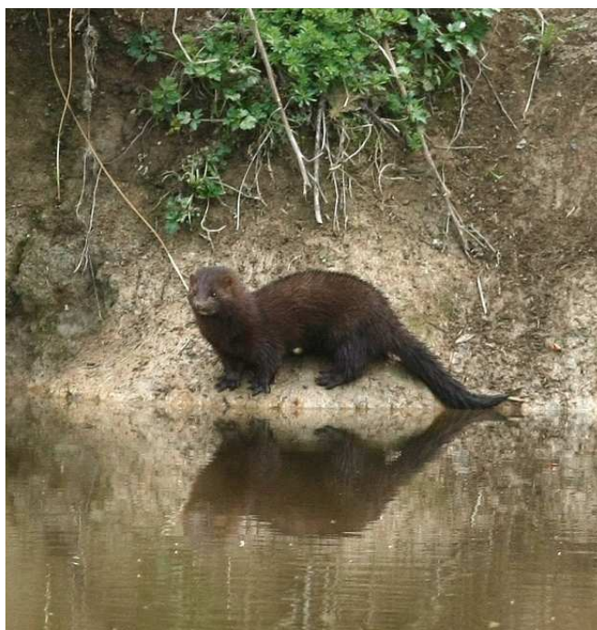
Vison d'Amérique, La Chapelle-sur-Erdre

Des empreintes et une épreinte fraîche de Loutre d'Europe , ont été observées au pied d'un ouvrage hydraulique le 2/03 sur le site ornithologique de la Mandine à Bouguenais (CM). L'espèce n'avait plus été contactée sur le site depuis la capture d'un individu dans une cage-piège, il y a plusieurs années. Un individu a été observé une nouvelle fois sur l'étang de Clégreuc le 15/03 (FL) et le cadavre d'une femelle adulte, victime de collision routière, a été trouvé le 9/03 sur la RD 723 à hauteur des marais de Messan à Rouans (FN). Des épreintes fraîches ont été notées le 25/03 sur le Falleron à Touvois (EO) et sur la Maine à Saint-Lumine-de-Clisson (SD). Des épreintes fraîches et une place de miction ont été relevées entre Treffieux et Issé lors de prospections sur le Don le 8/04 (PhD, DM), mais toujours aucun indice de présence noté en amont d'Issé. Enfin, les restes d'une brème prédatée par une Loutre ont été trouvés le 16/04 sur les quais des bords de l'Erdre, rue Sully, en plein centre de Nantes (BL) !