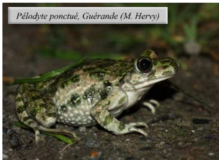
Pélodyte ponctué, Guérande (M. Hervy)

Parmi les nombreux signalements de Pélodyte ponctué , notons la présence de l'espèce le 15/03 au Pellerin (FN), le 18/03 à Montrelais et au Fresne-sur-Loire (PB/TH), le 18/03 à Guérande (MH), le 22/03 à Vritz (GM), et le 27/04 sur la boire Torse à Anetz (PB). L' Alyte accoucheur a été signalé de manière fort intéressante le 3/03 en forêt de Domnaiche à Lusanger (DM, OP, MR), le 20/03 dans le bourg du Croisic (OV), et le 23/04 à proximité des prairies des bords de Sèvre à Rezé (AV/GM). Une nouvelle population nantaise a été détectée le 14/03 à proximité du centre Cambronnie (JF). Un mâle, transportant les œufs, a été observé le 29/03 à Boussay (PT).