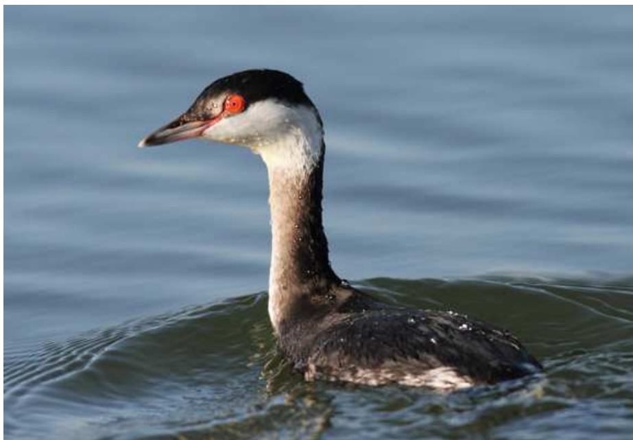
Grèbe esclavon, Herbignac (J.P. Tilly)

Grèbe esclavon : 1 oiseau le 2/01 à la Balise du Traict, Batz-sur-Mer (MH), 1 le 4/01 dans le Port du Croisic (JM), 1 du 13 au 26/01 à Kercouret, Herbignac (EB, JPT, OPo), 1 le 15/01 aux Mabons, Le Croisic (MR), 1 le 26/01 à la Jonchère de Lenigo, Batz-sur-Mer (JPT), 1 à Belmont, La Turballe le 8/02 (CG ; AP), 1 dans le Chenal de Pen Bron, Guérande le 16/02 (AJ) et 2 le 19/02 dans la Rade du Croisic, La Turballe (CH).