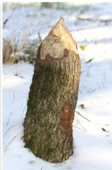
Castor d'Europe (Terrier et coupe), vallée du Hâvre (B. Livoir)

A noter une nouvelle mention (DM) de Rat noir , espèce rarement citée et vraisemblablement, peu commune en Loire-Atlantique, suite à la découverte, par Fred Touzalin, d'un cadavre complet, tout sec et momifié, à Fresnay-en-Retz (ancienne laiterie) à proximité d'un site de réjection d'une Effraie des clochers. Egalement dans un lot de pelotes, mais cette fois en provenance de l'île de Ménac à Saint-Joachim (DM), un crâne de Campagnol amphibie, et un crâne incomplet de Rattus , présentant des critères pouvant évoquer le Rat noir. La détermination, à confirmer, est toutefois plus délicate en raison de l'absence des mandibules et de plusieurs parties du calvarium. Signalons, pour finir, qu'un projet d'arrêté (en consultation sur le site du ministère de l'Ecologie : 20 mars 2012) propose d'ajouter 3 espèces à la liste des mammifères terrestres protégés en France : le Murin d'Escalera, le Bouquetin des Pyrénées et le Campagnol amphibie.