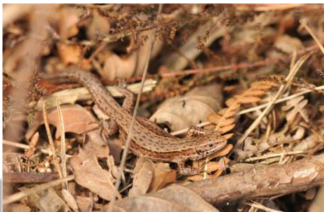
Lézard vivipare, forêt de Juigné (B. Baudin)