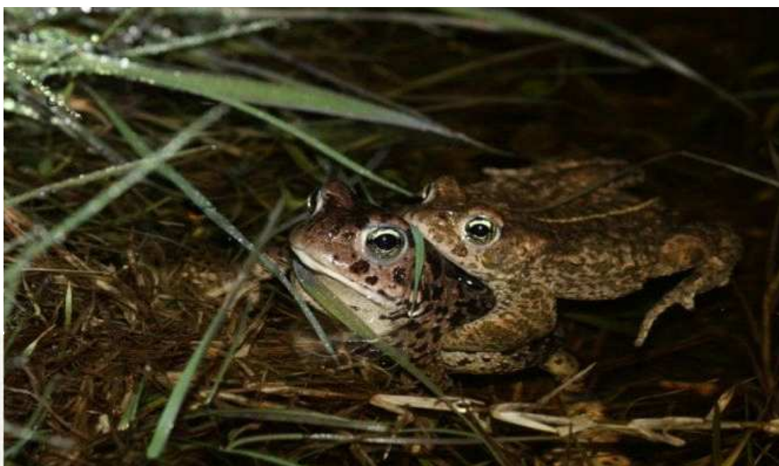
Amplexus de Crapauds calamites Le croisic, (M. Hervy)