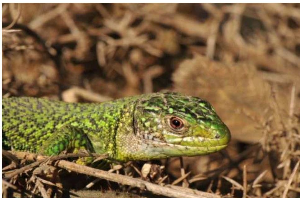
Lézard vert, forêt de Juigné (B. Baudin)

Le Lézard vivipare , espèce cantonnée au nord-Loire, et sans doute en régression, a fait l'objet de deux mentions : le 25/02 sur une lande humide en bordure de la forêt de Juigné (BB), et le 28/02 sur la tourbière de Ligné (CM). Nous rapportons également le témoignage d'un habitant de Saint-Fiacre-sur-Maine qui fait état d'une observation en 2011 de pontes de Tortue de Floride dans les vignes, à la confluence de la Sèvre et de la Maine (PT). Il semble cependant que les conditions climatiques de nos latitudes ne soient pas encore favorables à un développement embryonnaire complet, mais avec le changement global en cours, ces tentatives de reproduction sont à surveiller. Cette observation constitue, à notre connaissance, le premier témoignage de ponte in natura en Loire-Atlantique.