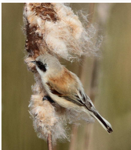
Rémiz penduline, Les Moutiers-en-Retz (O. Penard)