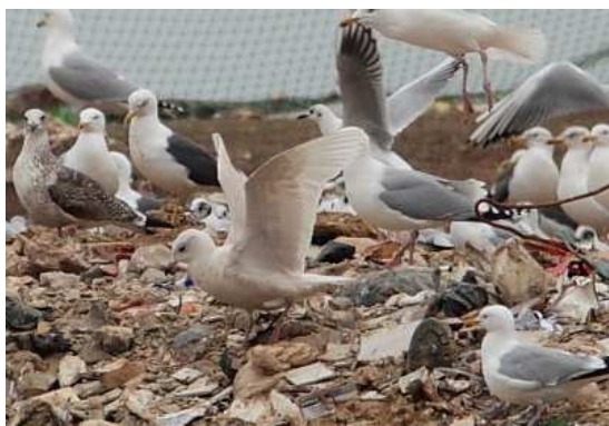
Goélands à ailes blanches, 1er hiver, Mésanger à g., et 2ème hiver, Grand-Lieu à d.

Bruant des neiges : 1 oiseau du 8/01 au 22/01 à l'Étier de la Chauvette, Batz-sur-Mer (JMV, SG, OPo).