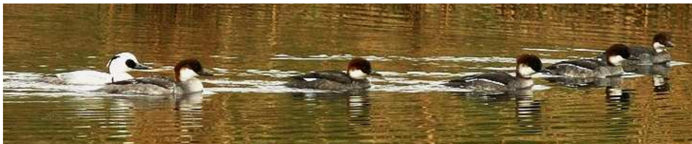
Harles piettes, Le Pellerin

Ndlr : Cette rubrique reprend les observations récentes d'oiseaux en Loire-Atlantique, parvenues au GNLA par le biais du forum électronique et de la base de saisie en ligne « faune-Loire-Atlantique » à laquelle le GNLA contribue. Les données marquées d'astérisques sont mentionnées sous réserve d'homologation régionale (*) ou nationale (**).