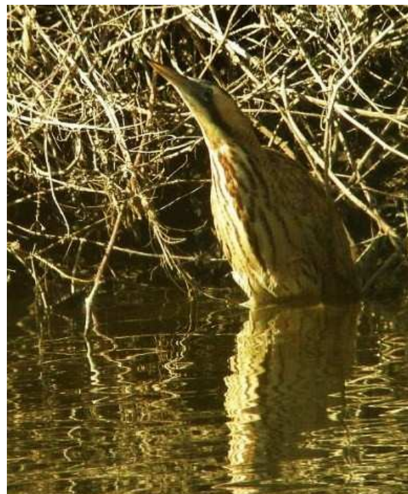
Butor étoilé, Maisdon-sur-Sèvre (L. Bauza)

Plongeon imbrin : Hors littoral, 1 le 6/01 au Lac de Grand-Lieu (SR).