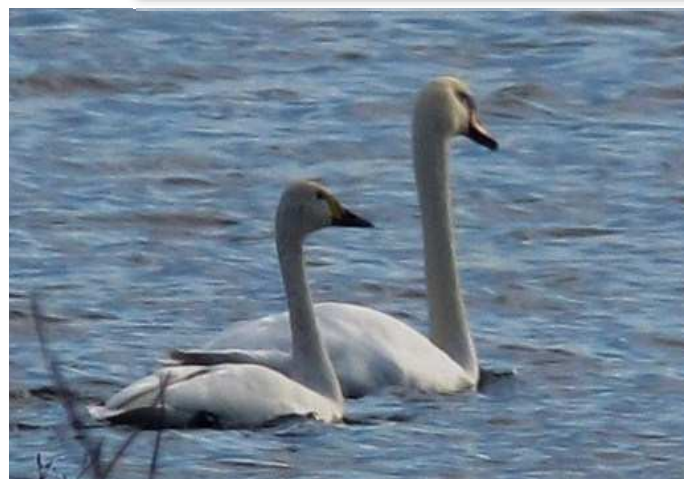
Cygne de Bewick, Saint-Herblon (M. Sinoir)

Garrot à œil d'or : 5 individus le 06/01 au Lac de Grand-Lieu (SR), 1 le 08/01 (le même que lors de la période précédente ?) au Port du Collet, Les Moutiers-en-Retz (WM), 11 (dont 5 mâles adultes) le 6/02 au Lac de Grand-Lieu (SR) et 1 type femelle le 19/02 à l'Étang Aumée, Fégréac (ON).