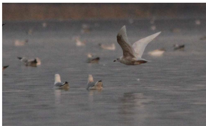
Goéland à ailes blanches, Grand-Lieu (S. Reeber)

Mésange noire : 1 seule donnée durant la période concernée, au moins 3 oiseaux le 21/12 à la Lanterne des Morts, Les Moutiers-en-Retz (OP).