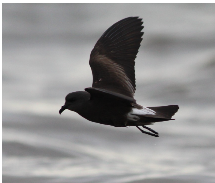
Océanite culblanc, Grand-Lieu (S. Reeber)

Océanite culblanc : 1 le 16/12 au Lac de Grand-Lieu (SR).