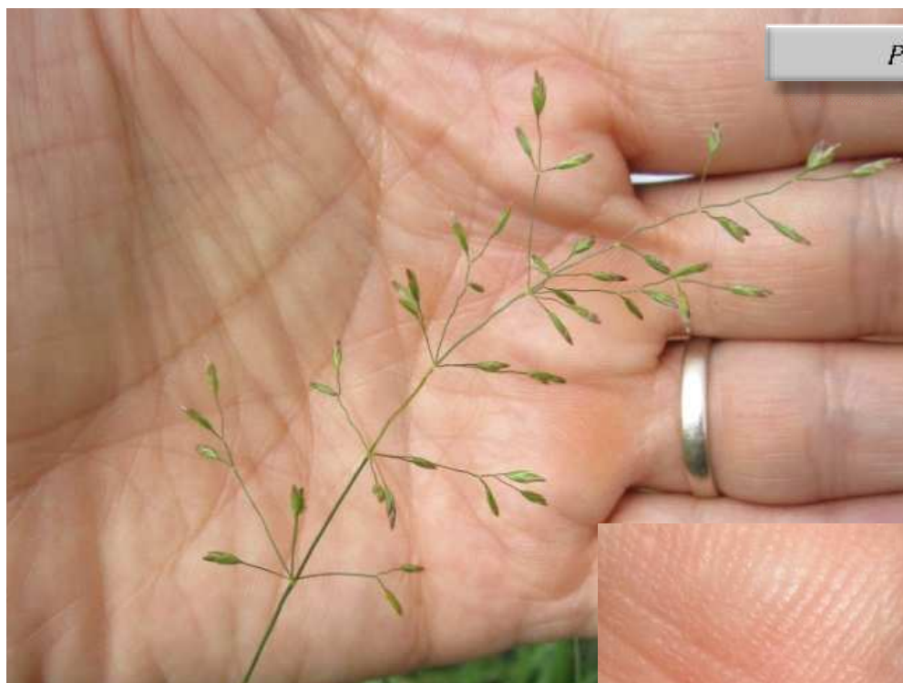
Poa palustris , panicule