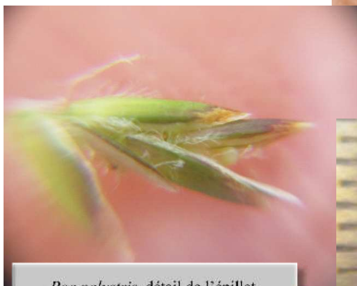
Poa palustris , détail de l'épillet, glumelles inférieures (=lemmes) panachées de jaune et violet