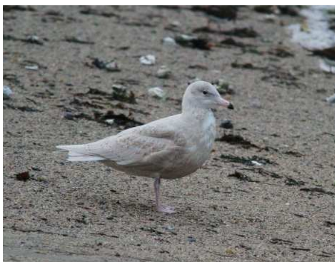
Goéland bourgmestre, Piriac (G. Bertiau)