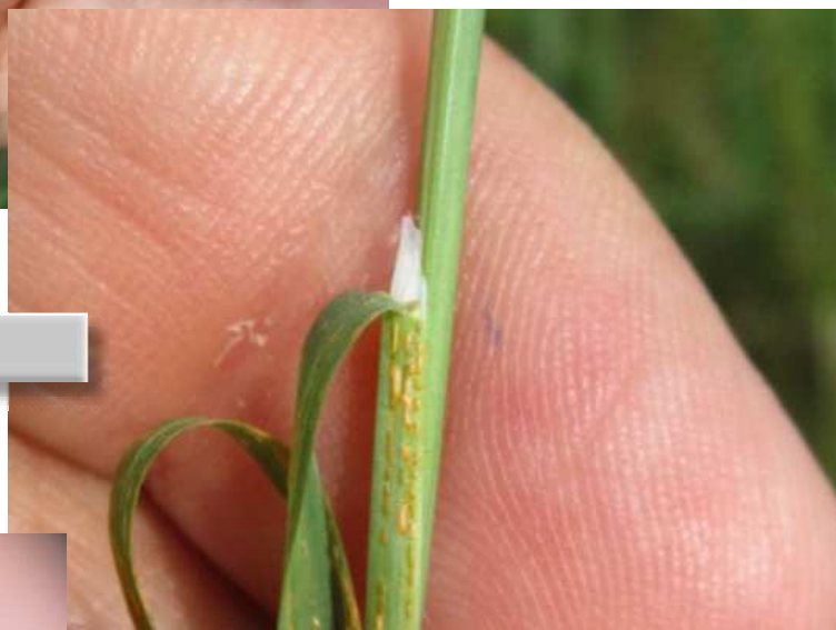
Poa palustris , ligule