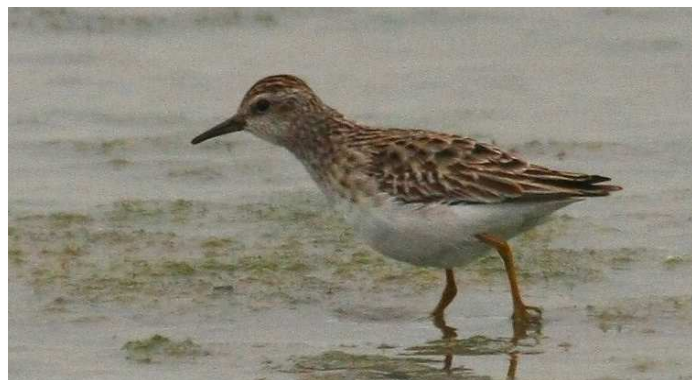
Bécasseau à longs doigts, La Turballe

Bécasseau à longs doigts ** : Premier mention française de ce limicole qui se reproduit en Sibérie et hiverne en Asie. L'individu est découvert sur la saline Gau, La Turballe le 1/11 (OV), il est réobservé le 05/11 (EA) et son identification est confirmée le 6/11 (JM, AM, WR et al.). L'oiseau n'est pas réobservé du 11/11 au 18/11, puis il est retrouvé le 19/11 (SR, MC) et revu jusqu'au 21/12. Par la suite, il ne sera plus vu, puis, de nouveau retrouvé, à la mi-janvier (voir prochain bulletin).