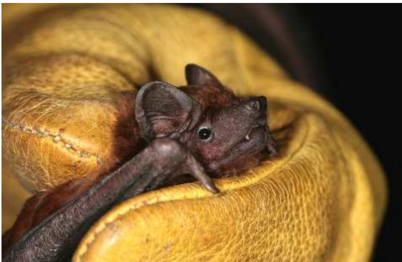
Noctule commune (P. Bellion)

Le même soir en acoustique, quelques séquences attribuables à de la Pipistrelle de Nathusius (LG, PP, DL, LC). Les captures se sont enchaînées avec le 01/06 à l'étang de la Provostière, 23 bêtes au total capturées dont 13 Pipistrelles communes , 3 Pipistrelle sp. , 4 mâles et 2 femelles allaitantes de Murins de Daubenton ainsi qu'1 mâle de Murin à moustaches . Pendant ce temps au détecteur acoustique ont été identifiées Pipistrelles de Kuhl , Pipistrelles de Nathusius (en Quasi Fréquence Constante à 39-40 kHz de fréquence terminale) et Noctules communes (LG, PB).