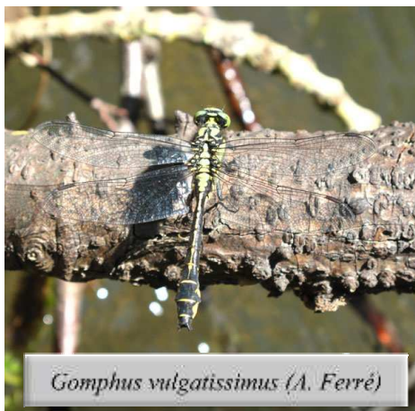
Gomphus vulgatissimus (A. Ferré)