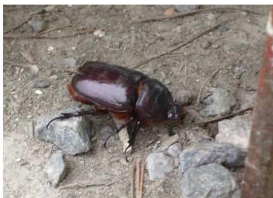
Oryctes nasicornis (E. Cohin)

nous signale la présence à Bouaye du Rhinocéros ( Oryctes nasicornis ), avec une femelle photographiée le 18/06, et PT observe le 24/06 à Ab-baretz, sur un site où elle est connue depuis longtemps, Cicindela hybrida , une cicindèle d'ordinaire inféodée aux zones sablonneuses essentiellement littorales.