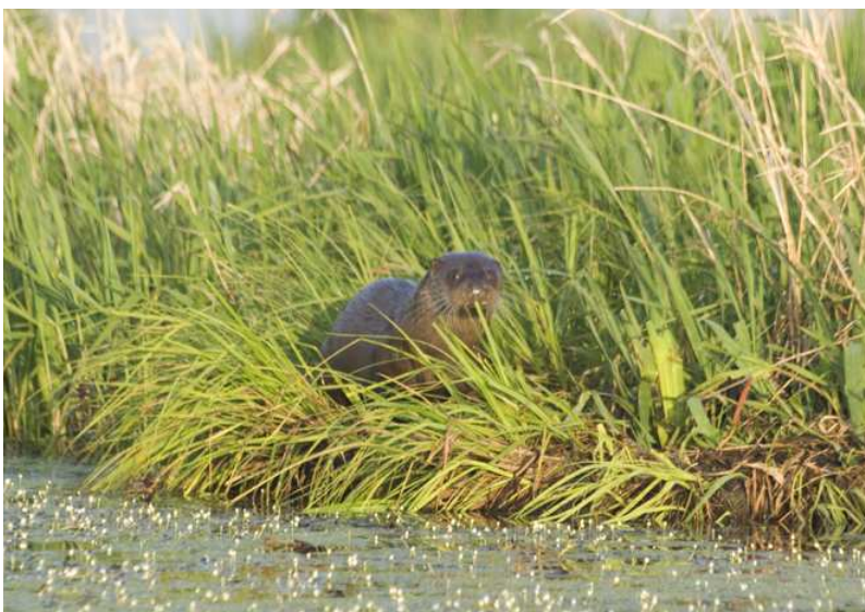
Loutre, 23 avril 2010, Brière

Enfin, information importante, une observation visuelle de Genette a été réalisée en Nord-Loire, commune d'Oudon, Les Pontonneries, le 27/06 (PB), ce qui semble confirmer l'expansion progressive de cette espèce au-delà de la Loire dans notre département, déjà sérieusement suspectée (cf : « Note sur...une genette en Nord-Loire ? », Bulletin n°36, novembre-décembre 2009). Afin de disposer d'éléments tangibles pour mesurer l'éventuelle évolution de la distribution de cette espèce, merci de nous communiquer toute les observations, directes ou indirectes, que vous seriez amenés à réaliser au nord du fleuve.