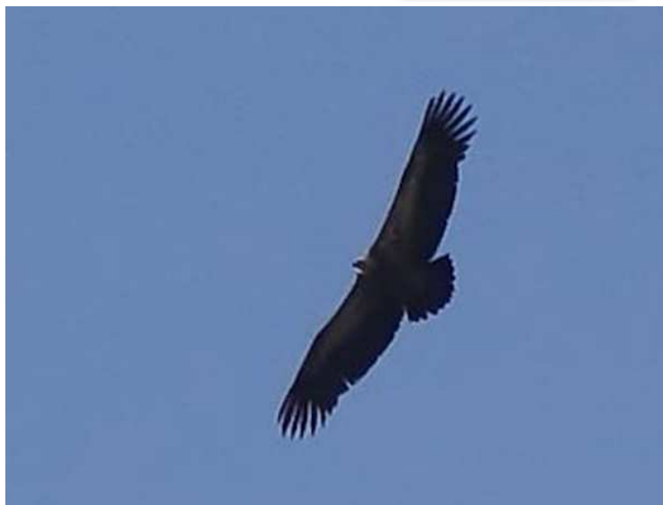
Vautour fauve, marais de Grée.