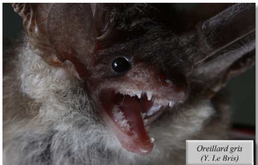
Oreillard gris (Y. Le Bris)

Bilan : 31 femelles réparties dans deux bâtiments, une bonne partie des femelles est allaitante, mais il reste encore des gestantes (LBe et PB). Le 28/06, sur le site de Saint-Clolomban, comptage en sortie d'un gîte étant derrière des volets en bois de châtaigner : 74 Barbastelles d'Europe , dont 40 jeunes et 12 adultes qui sont restés derrière les volets (face nord), 62 Pipistrelles sp. (face sud), 1 Sérotine commune (aussi derrière un volet avant sa sortie) ainsi qu'une Noctule commune (FD et EO). Enfin, le 29/06, à la suite d'un SOS chiro aux Sorinières, 45 Pipistrelles communes dénombrées ainsi que deux autres individus dans une maison voisine (DL et AV). Vive le bouche-à-oreille !