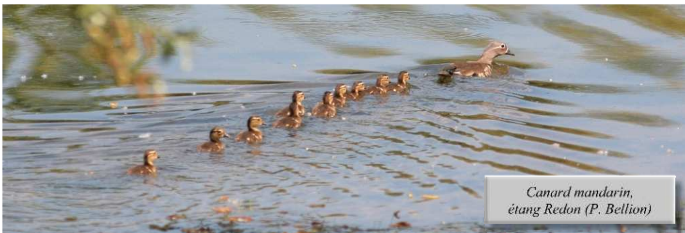
Canard mandarin, étang Redon

Cette période printanière n'est pas des plus propices pour l'observation des canards et oies, à l'exception d'oiseaux issus de populations férales, comme ces 2 Bernaches du Canada le 9/05 en Brière (DM), ces 3 Bernaches nonnettes le 13/05 au même endroit (JLD) ou encore cette nichée de Canard mandarin comptant 10 poussins les 19/05 et 5/06 à l'Etang d'Oudon, un nouveau site pour l'espèce (PB, HT). Signalons tout de même 8 Bernaches cravants le 25/06 dans l'estuaire de la Loire entre Cordemais et Donges (HT, FL) et 1 mâle de Fuligule nyroca * les 6/05 et 2/06 à Grand-Lieu (DM, SR). Deux Cormorans huppés continuaient leur séjour au Tréhic le 13/05 (MF), alors que 2 Ibis falcinelles * ont été notés, l'un à Grand-Lieu à partir du 3/05 et jusqu'en août (WM, SR), l'autre le 8/06 en Brière (JLD & al.). Egalement intéressants, ce Crabier chevelu observé le 27/06 le long du périphérique nantais à hauteur de Bouguenais (AM), ce Héron pourpré vu le 12/05 au Massereau (FL) et ce groupe de 37 Cigognes blanches le 5/06 au Grand Port, Saint-Lumine-de-Coutais (WM, LB). L'estivage d'oiseaux immatures sur ce secteur prend de l'importance chaque année, et des simulacres de nidification ont de nouveau été observés cette année.