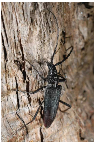
Cerambyx cerdo (P. Trécul)

Un certain nombre d'observations de Cerambycidae ont été rapportées via le forum, elles ont été retransmises avec l'accord de leurs auteurs au GRETIA qui finalise actuellement un projet d'Atlas des longicornes du massif armoricain. Merci à tous les contributeurs ! Ces données sont consultables par tous les membres du GNLA sur simple demande à treculp@yahoo.fr