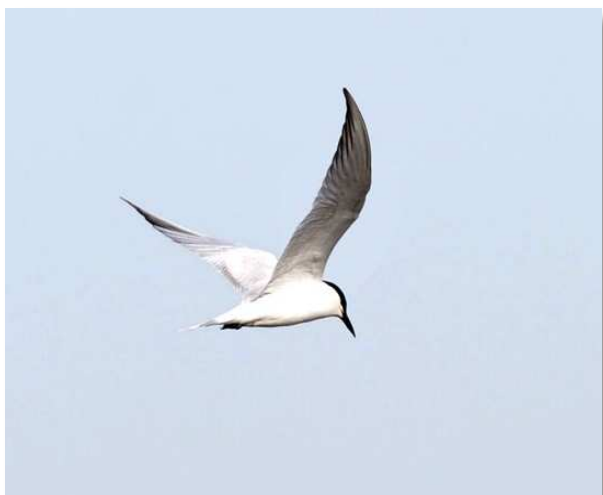
Sterne hansel, Brière (J.-L. Dourin)

Combattants variés, Brière (J.-L. Dourin)