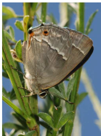
Neozephyrus quercus (P. Trécul)