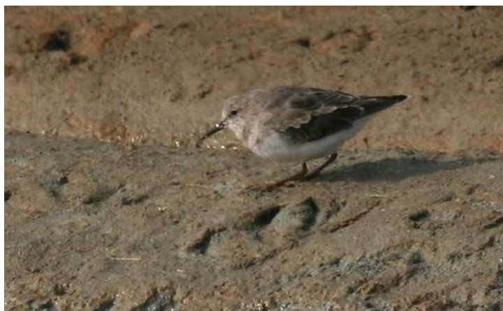
Bécasseaux de Temminck, marais de Grée (H. Touzé) à g. et Guérande (C. Perry) à d.