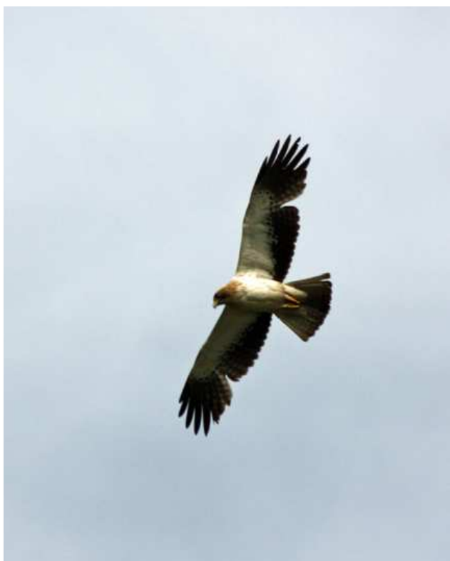
Aigle botté, Brière (A. Corbeau).