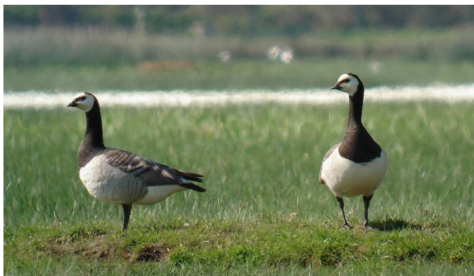
Bernaches nonnettes, Brière

Ndlr : Cette rubrique reprend les observations récentes d'oiseaux en Loire-Atlantique, parvenues au GNLA. Les données marquées d'astérisques sont mentionnées sous réserve d'homologation régionale (*) ou nationale (**).