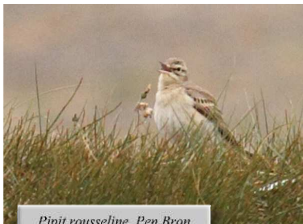
Pipit rousseline, Pen Bron (A. Mousseau)