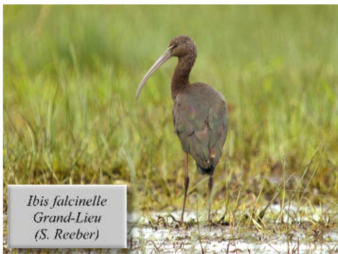
Ibis falcinelle Grand-Lieu (S. Reeber)

Cette période printanière n'est pas des plus propices pour l'observation des canards et oies, à l'exception d'oiseaux issus de populations férales, comme ces 2 Bernaches du Canada le 9/05 en Brière (DM), ces 3 Bernaches nonnettes le 13/05 au même endroit (JLD) ou encore cette nichée de Canard mandarin comptant 10 poussins les 19/05 et 5/06 à l'Etang d'Oudon, un nouveau site pour l'espèce (PB, HT). Signalons tout de même 8 Bernaches cravants le 25/06 dans l'estuaire de la Loire entre Cordemais et Donges (HT, FL) et 1 mâle de Fuligule nyroca * les 6/05 et 2/06 à Grand-Lieu (DM, SR). Deux Cormorans huppés continuaient leur séjour au Tréhic le 13/05 (MF), alors que 2 Ibis falcinelles * ont été notés, l'un à Grand-Lieu à partir du 3/05 et jusqu'en août (WM, SR), l'autre le 8/06 en Brière (JLD & al.). Egalement intéressants, ce Crabier chevelu observé le 27/06 le long du périphérique nantais à hauteur de Bouguenais (AM), ce Héron pourpré vu le 12/05 au Massereau (FL) et ce groupe de 37 Cigognes blanches le 5/06 au Grand Port, Saint-Lumine-de-Coutais (WM, LB). L'estivage d'oiseaux immatures sur ce secteur prend de l'importance chaque année, et des simulacres de nidification ont de nouveau été observés cette année.