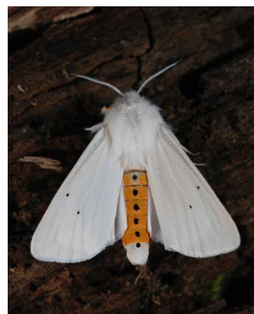
Spilosoma urticae (P. Trécul)