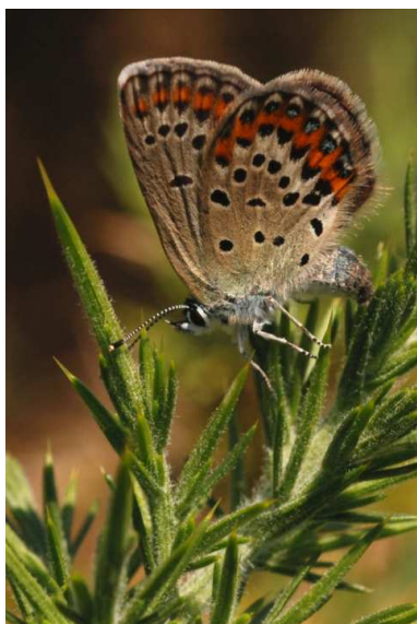
Plebejus idas (P. Trécul)

Le début de printemps offre toujours quelques observations de papillons de jours bien agréables après un hiver sans battements d'ailes. Papilio machaon (le Machaon ) est signalé le 05/05 à la Chevrolière et à Corcoué sur Logne (PT), le 17/05 à St Brévin les pins (JF), le 18/05 et le 29/06 à Vertou (AV). Cyaniris semiargus (le Demi-Argus ), espèce très discrète, a été revue le 19/05 (LB) dans les marais de Goulaine non loin du pont de l'Ouen et à Gorges le 20/05 dans les prairies maigres d'Angreviers (PT). Euphydryas aurinia (le Damier de la succise ) n'est mentionné qu'une seule fois au Pont de l'Ouen le 19/05 par LB. Le Gazé ( Aporia crataegi ) a été vu le 03/06 au Pont de l'Ouen (LB), le 14/06 à Lavau (JF) et le 24/06 à Nort sur Erdre dans les Marais de Blanche Noë (PT). Le Flambé ( Iphiclides podalirius ), dont la reproduction en Loire-Atlantique n'a toujours pas été prouvée à fait l'objet d'une seule mention le 04/06 à la base de loisirs de Pont-Caffino à Maisdon sur Sèvre (PT). Un imago tout frais en vol... Le Thécla du Chêne ( Nezophyrus quercus ) est observé à deux reprises par PT le 24/06 à Nozay et le 25/06 à Boussay. L' Azuré du Genêt ( Plebejus idas ) rarissime dans notre département est observé en grande densité au lieu-dit la Ville au Chef le 24/06 par PT et JAG.