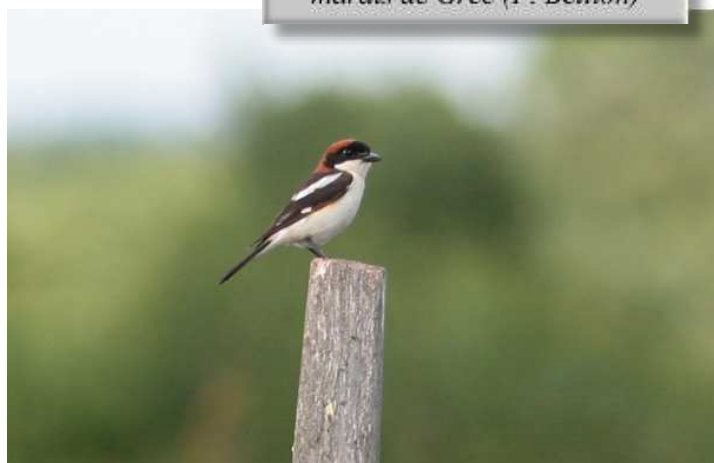
Pie-grièche à tête rousse, marais de Grée (P. Bellion)