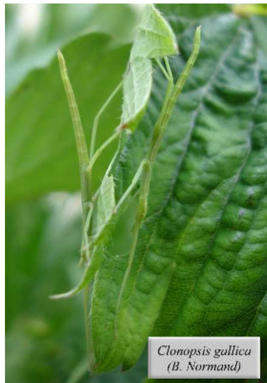
Clonopsis gallica (B. Normand)

Finissons pour ce groupe avec Clonopsis gallica , une espèce de Phasme très courante jusque dans nos potagers mais pourtant mal recensée en Loire-Atlantique, mentionnée à 5 reprises durant ces deux mois : le 31/05 par BN, le 10/06 à Boussay (PT), le 19/06 à La Marne (PT), puis le 24/06 à Nort sur Erdre (PT) et au Pallet (LT).