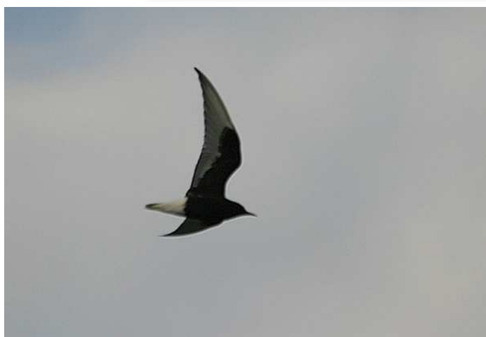
Guifette leucoptère, Grand-Lieu (L. Bauza)