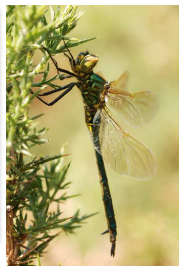
Somatochlora metallica (P. Trécul)