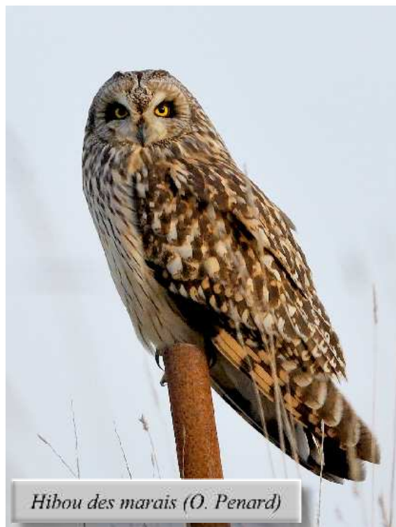
Hibou des marais (O. Penard)