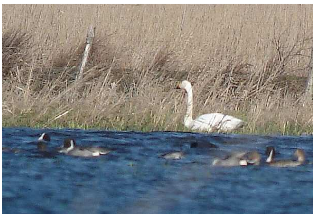
Cygne de Bewick en Brière (J.-L. Dourin).

Le site de Lavau a par ailleurs accueilli de beaux groupes d' Oies cendrées , avec notamment 240 oiseaux le 17/01 (WM), 270 le 31/01 (FL), 500 le 8/02 (HT, WR, AM), 550 le 19/02 (JLD) et 557 le 20/02 (FR). Autre oie rare, une Bernache cravant du Pacifique* se trouvait dans les Traicts du Croisic le 8/02 (HT, WR, AM) et a été revue plusieurs fois par la suite. Quelques oiseaux issus de populations férales ont également été notés, avec la bande classique de Bernaches du Canada de Mazerolles qui comptait 31 ind. le 16/02 (ATe), 11 oiseaux le 4/01 au Marais de Grée (PB), et 10 le 4/02 à Lavau (NC, EA), ainsi que des Cygnets noirs avec jusqu'au 11 oiseaux à Grand-Lieu (SR) et 2 le 8/02 dans le Petit Traict (HT, WR, AM), 1 puis 2 Tadornes casarca les 4 et 13/02 à Lavau (NC, EA, WM, FR) et un couple de Canards carolins à Grand-Lieu du 25/02 au 6/03 (SR).