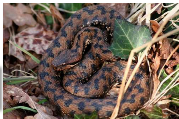
Vipère aspic (F. Thal)

La fin du mois de février correspond au « réveil » des serpents après leur torpeur hivernale. Les premières observations sont faites à la faveur du redoux. Ainsi, une Vipère aspic prenant le soleil est observée le 20/02 à Legé (FT). Le même jour, un mâle de Vipère péliade est observé longuement dans un site bien fréquenté par l'espèce, à Kerougas, Herbignac (DM). Enfin, le 28/02, après le passage de la tempête Xynthia et l'inondation des prairies de l'estuaire de la Loire, une Couleuvre d'Esculape est observée, fuyant l'inondation et réfugiée dans un Prunellier bordant le Chemin des Carris, Frossay (FN).