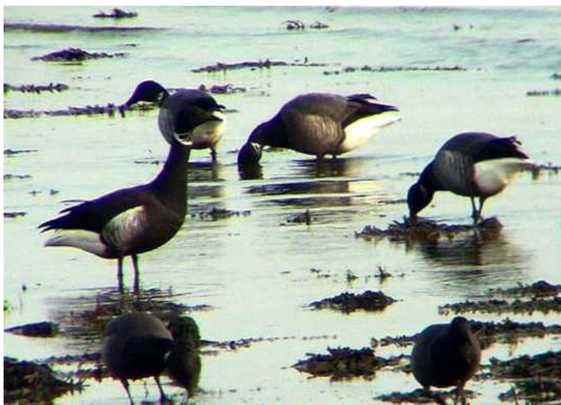
Bernache cravant du Pacifique le Croisic (H. Touzé), à gauche sur les deux photos.