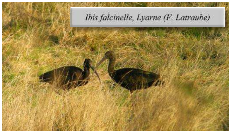
Ibis falcinelle, Lyarne (F. Latraube)