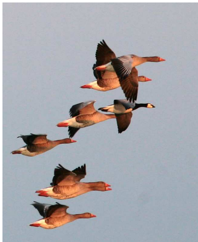
Oies cendrées et Bernache nonnette ci-dessus et Oies rieuses ci-dessous, marais de Grée (P. Bellion)