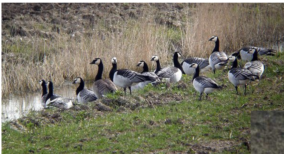
Troupe de Bernaches nonnettes au Collet (F. Thal), avec un hybride B. nonnette x B. du Canada (ci-dessous)

Le site de Lavau a par ailleurs accueilli de beaux groupes d' Oies cendrées , avec notamment 240 oiseaux le 17/01 (WM), 270 le 31/01 (FL), 500 le 8/02 (HT, WR, AM), 550 le 19/02 (JLD) et 557 le 20/02 (FR). Autre oie rare, une Bernache cravant du Pacifique* se trouvait dans les Traicts du Croisic le 8/02 (HT, WR, AM) et a été revue plusieurs fois par la suite. Quelques oiseaux issus de populations férales ont également été notés, avec la bande classique de Bernaches du Canada de Mazerolles qui comptait 31 ind. le 16/02 (ATe), 11 oiseaux le 4/01 au Marais de Grée (PB), et 10 le 4/02 à Lavau (NC, EA), ainsi que des Cygnets noirs avec jusqu'au 11 oiseaux à Grand-Lieu (SR) et 2 le 8/02 dans le Petit Traict (HT, WR, AM), 1 puis 2 Tadornes casarca les 4 et 13/02 à Lavau (NC, EA, WM, FR) et un couple de Canards carolins à Grand-Lieu du 25/02 au 6/03 (SR).