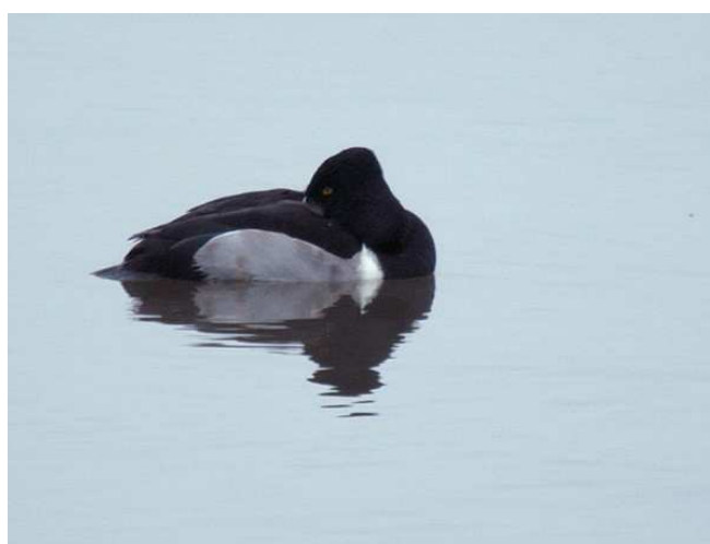
Fuligule à bec cerclé, Grand-Lieu

Pour le Plongeon arctique , un total exceptionnel de 15 oiseaux devant la côte du Croisic le 10/01 (équipe Wetlands), et encore 1 le 31/01 au même endroit (FR). Enfin, pour le Plongeon imbrin , l'espèce est présente en permanence devant le Croisic, sur le secteur habituel du Tréhic notamment, avec 2 oiseaux signalés le 2/01 (FR), 4 le 10/01 (équipe Wetlands), et encore 1 les 31/01 et 8/02 (FR, HT, WR, AM). Pas d'afflux particulier en revanche concernant les grèbes, une seule observation ayant été signalée pour le Grèbe esclavon , d'un oiseau le 2/01 à la Pointe du Croisic (FR), site où furent également observés régulièrement quelques Cormorans huppés .