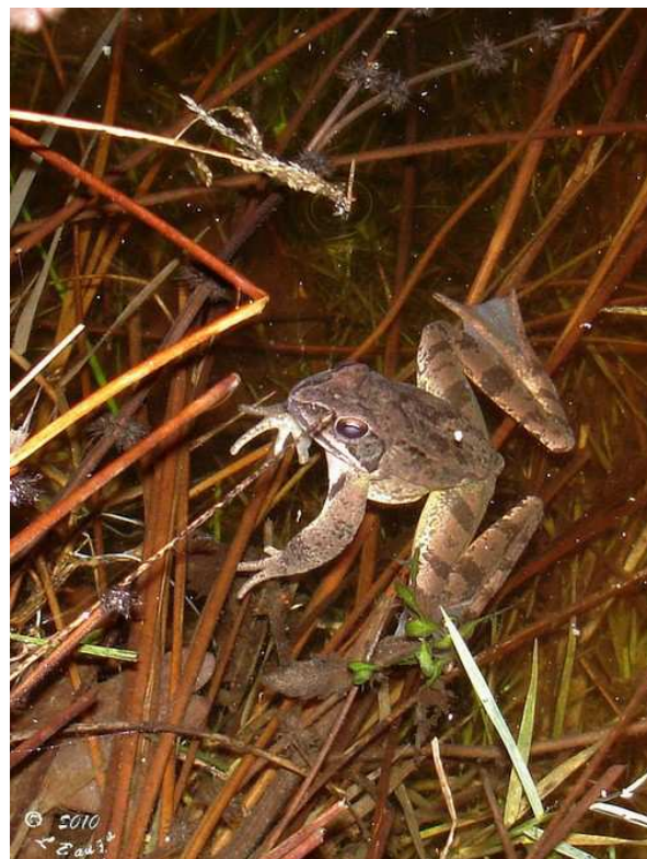
Grenouille agile (L. Bauza)

Chez les Anoures, la Grenouille agile commence à se manifester avec quelques individus dans l'eau à Sainte-Reine-de-Bretagne le 18/01 (DM), 5 individus à La Montagne le 03/02 (AO), quelques individus à Touffou le 05/02 (LB), ou à la Blandinière le 22/02 (AV, GM), observations suivies de chœurs et d'amplexus en Brière dès le 03/02 (DM), les premières pontes le 08/02 à Crossac (DM, TR), puis au Cellier le 22/02 (HT, OG). Le Pélo-dyte ponctué est entendu à Crossac le 08/02 (DM, TR) et quelques jours plus tard à Lavau (FN). Enfin, le Crapaud commun est signalé tout au long des deux mois en nombre réduit toutefois : 1 individu à La Montagne le 03/02 (AO), un autre à Touffou le 05/02 (LB), un à la Blandinière le 22/02 (AV, GM), un encore au Cellier le 22/02 (HT, OG) et un dernier pour février, à la Giraudière, Basse-Goulaine le 24/02 (LB).