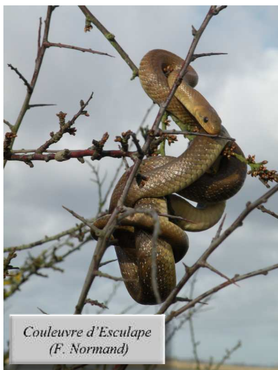
Couleuvre d'Esculape

La fin du mois de février correspond au « réveil » des serpents après leur torpeur hivernale. Les premières observations sont faites à la faveur du redoux. Ainsi, une Vipère aspic prenant le soleil est observée le 20/02 à Legé (FT). Le même jour, un mâle de Vipère péliade est observé longuement dans un site bien fréquenté par l'espèce, à Kerougas, Herbignac (DM). Enfin, le 28/02, après le passage de la tempête Xynthia et l'inondation des prairies de l'estuaire de la Loire, une Couleuvre d'Esculape est observée, fuyant l'inondation et réfugiée dans un Prunellier bordant le Chemin des Carris, Frossay (FN).