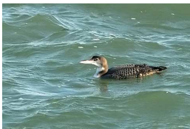
Plongeon imbrin, le Croisic (F. Roche)