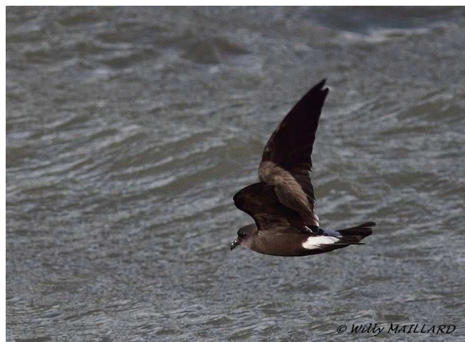
Océanite cul-blanc, côte nord, 29 novembre (W. Maillard ci-dessus, F. Carrié ci-dessous)