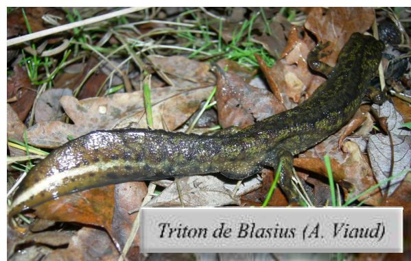
Triton de Blasius (A. Viaud)