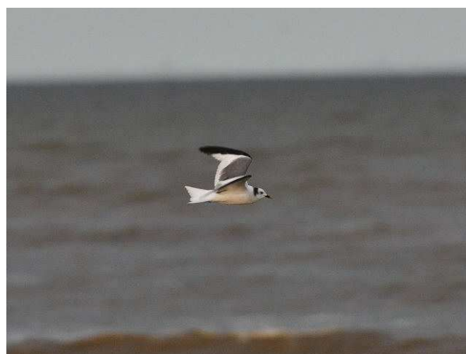
Mouette de Sabine, les Moutiers (O. Penard)