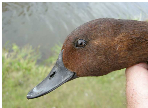
Hybride Nyroca x Milouin, Grand-Lieu (S. Reeber). Probablement impossible à distinguer d'un Nyroca, sauf par une barre alaire un peu grisée.

Débutons ce chapitre avec quelques oies peu communes à signaler : 1 Oie rieuse adulte très probable, vue en vol avec 8 oies cendrées le 3/11 à Saint-Joachim (DM) et 5 autres en compagnie de 230 cendrées à Grand-Lieu le 15/12 (SR), 1 Bernache cravant à ventre pâle le 18/11 à Grand-Lieu (SR) et une autre à partir 5/12 au Croisic (WR et al. ) en compagnie d'une Bernache cravant du Pacifique vue les 5 et 11/12 (WR,FR et al. ), ainsi que plusieurs données de Bernache cravant (ssp. nominale) en provenance de l'intérieur : 1 du 27/11 au 2/12 sur l'étang de Beaumont à Issé (site qui devient habituel pour l'espèce !) (JM, VT), 1 le 6/12 sur l'étang du Haut-Tesdan (ON), puis à Grand-Lieu : 1 le 13/11, 51 le 1/12, 2 le 11/12 et 1 le 31/12 (SR). Du côté des espèces échappées ou issues de populations férales, à noter 1 Tadorne casarca le 18/11 à l'Effettrie, Grand-Lieu (LB), et une Sarcelle tachetée le 9/11 à Grand-Lieu (SR). Nettement plus intéressantes, ces observations d'une ♀ de Sarcelle d'été le 7/12 au Masseureau (FL, YC), d'une ♀ de Canard à front blanc* du 18 au 23/11 à Grand-Lieu (SR) et d'un ♂ de Nette rousse le 13/11 sur le même site. Un Fuligule nyroca ♀ ad. se trouvait à Grand-Lieu à partir du 3/12 (SR), un ♂ de cette espèce était sur le même site à partir du 30/12 (SR) et un hybride Nyroca x Milouin probablement de seconde génération (croisement d'un hybride avec un Nyroca) a été capturé toujours au même endroit le 13/11 (SR).