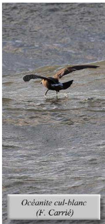
Océanite cul-blanc (F. Carrié)