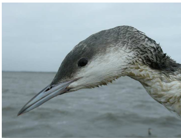
Grèbe jougris, le Croisic

Cette fin d'année 2009 aura été remarquable pour les observations de plongeurs. Pour le Plongeon imbrin , le premier oiseau a été vu le 5/11 à Grand-Lieu (SR), puis 1 le 13/11 au Tréhic (DR), 4 le 15/11 au Castouillet (AN), 1 le 18/11 entre Pen Bron et la Turballe (AM), 2 autres au Tréhic le même jour (AM) et 1 dans le Petit Traict le 25/11 (DR). Toujours au Tréhic, ils étaient trois le 23/11 (DR), puis quatre les 29/11 et 1/12 (WM, JM), à nouveau 3 le 5/12 (FR) et 2 les 7 et 11/12 (AM, FR). Deux ont ensuite été vus le 12/12 au Port-aux-Rocs (JLC), puis deux au large de Piriac le 27/12 (HT), peut-être pour partie les mêmes oiseaux. Dans l'intérieur, 2 oiseaux de 1 er hiver ont été signalés sur Vioreau le 2/12 (VT), puis un seul le 17/12 (JM, YB), alors qu'à Grand-Lieu, après celui du 5/11, 1 1 er hiver a été vu le 23/11, 1 1 er hiver également le 8/12, 1 ad. le 16/12 et 1 1 er hiver à partir du 30/12 (SR). Le Plongeon catmarin a été signalé un peu moins souvent, mais notons tout de même : 1 au Tréhic le 13/11 (DR), 1 à Pen Bron le 18/11 (AM), 4 le long de la Côte sauvage du Croisic le 19/11 (FR), 3 au Port-aux-Rocs le 13/12 (JLC), 1 au Tréhic le 13/12 (FR), 1 le 15/12 à Grand-Lieu (SR) et à nouveau 2 le long de la Côte sauvage du Croisic le 27/12 (HT). Le Plongeon arctique reste le plus rare des trois, mais un oiseau a été capturé accidentellement dans un filet de pêche, démaillé et relâché le 3/11 à Grand-Lieu (SR).