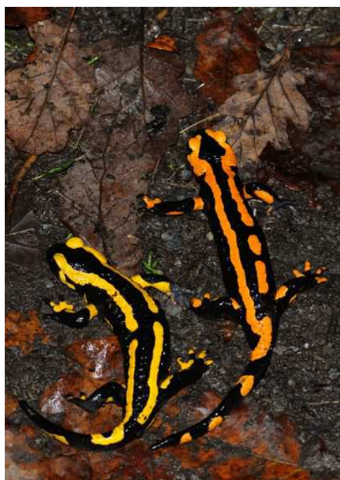
Salamandres tachetées, dont un individu orange, Touffou (P. Ouvrard)