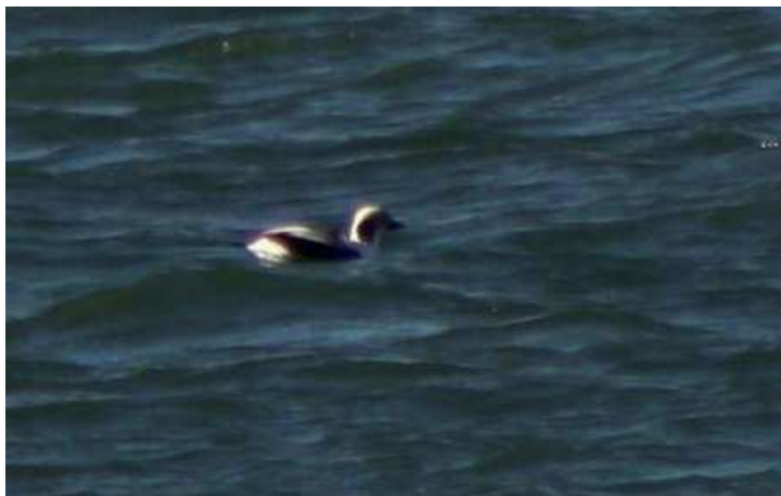
Harelda boréale ci-dessus (H. Touzé) et Harle huppé ci-contre (M. Sinoir), le Croisic.