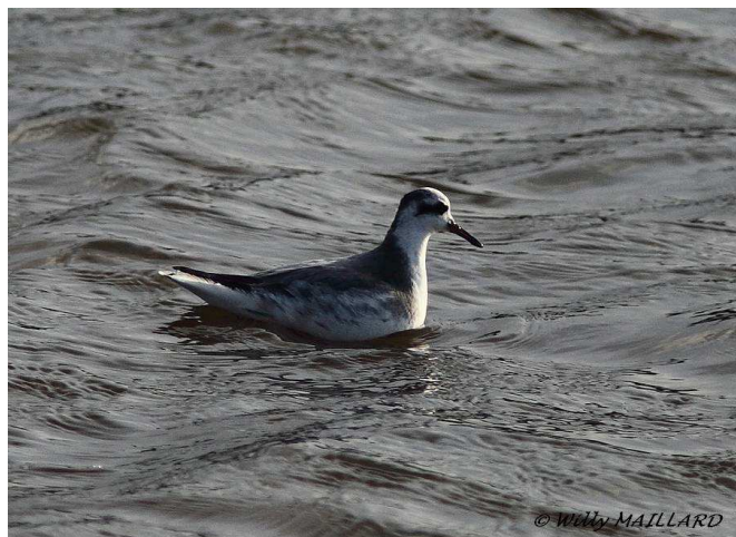
Phalarope à bec large, Sissable (W. Maillard)