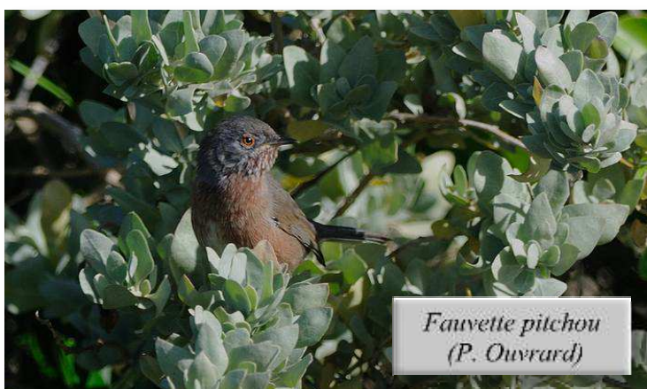
Fauvette pitchou (P. Ouvrard)