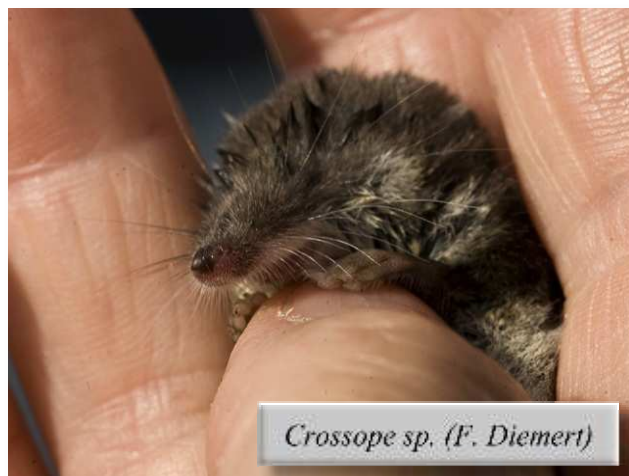
Crossope sp. (F. Diemert)

Commençons par cette observation d'une Belette d'Europe observée avec ses huit jeunes à Sainte-Reine-de-Bretagne le 04/07 (DM). C'est une observation remarquable car habituellement, chez la Belette, on ne compte qu'une ou deux portées par an, de quatre à six petits. Autre mustélidé, c'est un Putois d'Europe qui a été furtivement remarqué dans les marais de l'Erdre le 18/07 (BL). Une Fouine est observée à l'Effettrie, Grand-Lieu le 05/09 (LB), alors que sur le site de baguage du nord du lac, une Crossope sp. , probablement aquatique, s'est laissée attraper à la main le 30/09 (SR, FD et al.). Des épreintes et des reliefs de repas de Loutre ont également été trouvés le 17/10 à Boussay (PT). Toujours chez les petits carnivores, notons cette Genette morte sur la route près de Haute-Goulaine, le 20/08 (PO). Petit rongeur menacé encore bien présent en Loire-Atlantique, un Campagnol amphibie a été observé sur l'île de Mazun en Brière le 12/10 (DM). La Loutre, le Putois, la Genette et le Campagnol amphibie figurent désormais dans la liste des mammifères prioritaires des Pays de la Loire (cf. « Mammifères, amphibiens et reptiles prioritaires en Pays de la Loire », Conseil Régional, LPO Pays de la Loire, 2009, 125 pages).