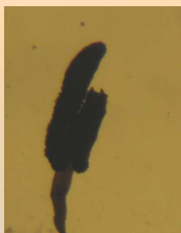
Anthères sans corne

Feuilles ovales aiguës de 2-3 mm (plus petite graduation = 0,5 mm)