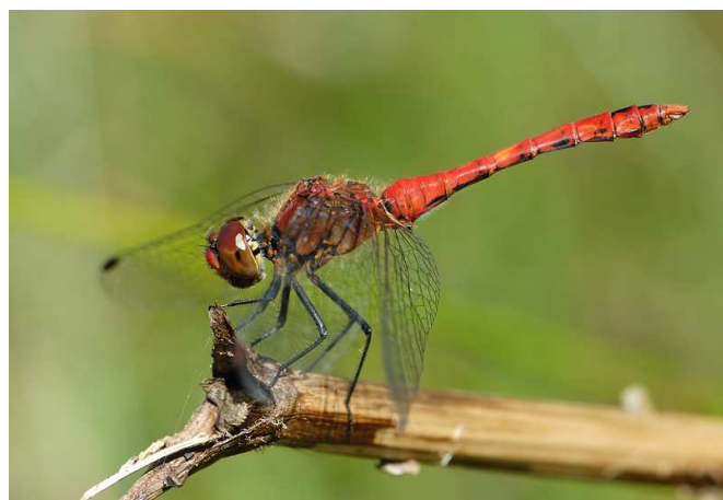
Sympetrum sanguineum (F. Roche)

Fin de saison pour les odonates ! A signaler tout de même 2 Aeschna mixta et Aeschna cyanea le 14/09 à Mauves-sur-Loire (PT), 1 A. mixta à Grand-Lieu le 17/09 (SR), 1 autre A. cyanea le 6/09 à la Montagne (AO) et 1 le 12/10 à Vertou (AV). Egalement les derniers Sympetrum striolatum et Chalcolestes viridis le 17/10 dans le Marais Audubon (FR).