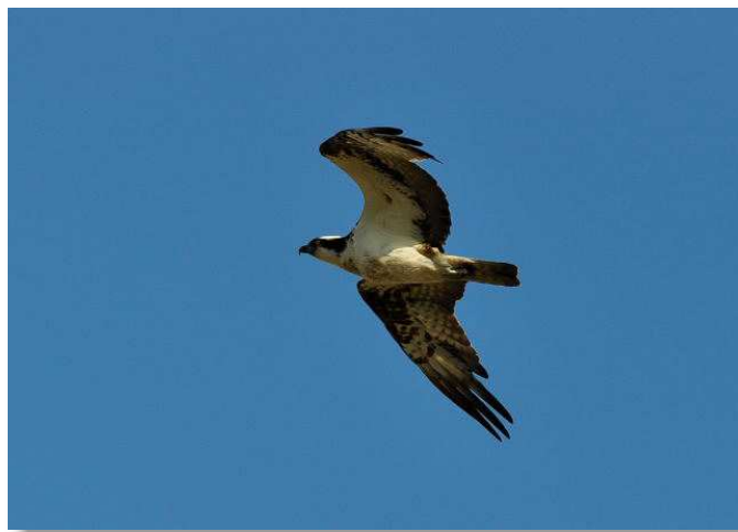
Balbuzard (O. Penard)