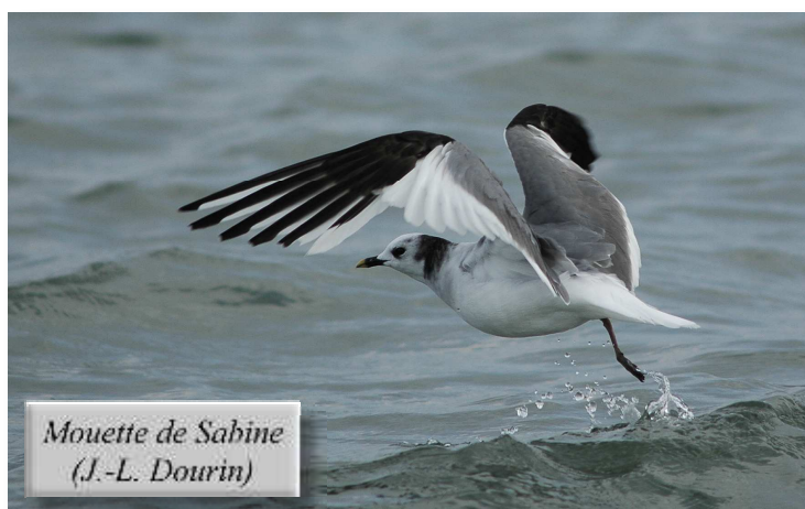
Mouette de Sabine (J.-L. Dourin)