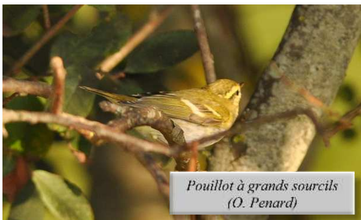
Pouillot à grands sourcils (O. Penard)