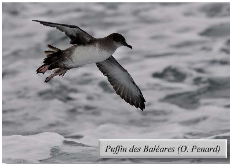
Puffin des Baléares (O. Penard)