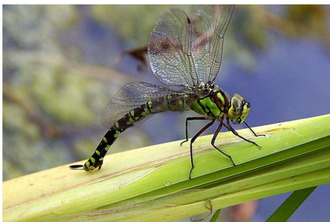
Aeschna cyanea (A. Oates)