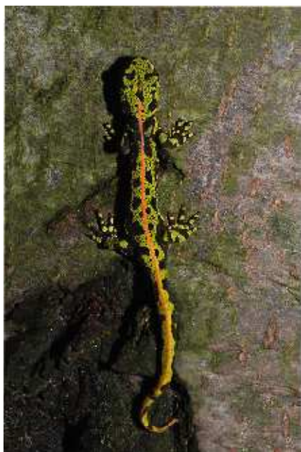
Triton marbré (P. Trécul)