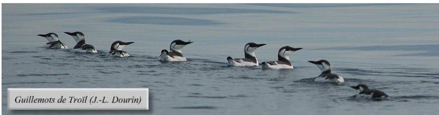
Guillemots de Troil (J.-L. Dourin)