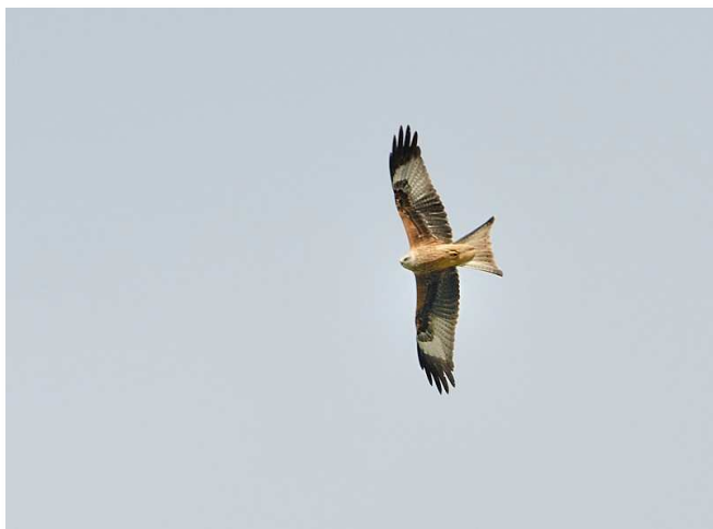
Milan royal (F. Roche)