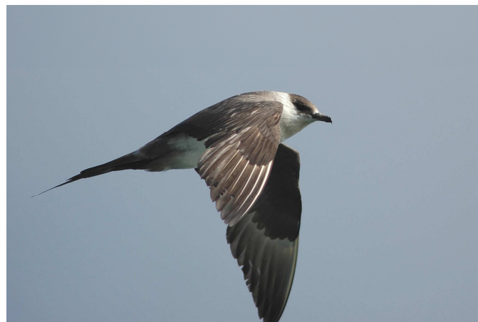
Labbes parasites - Estuaire de la Vilaine