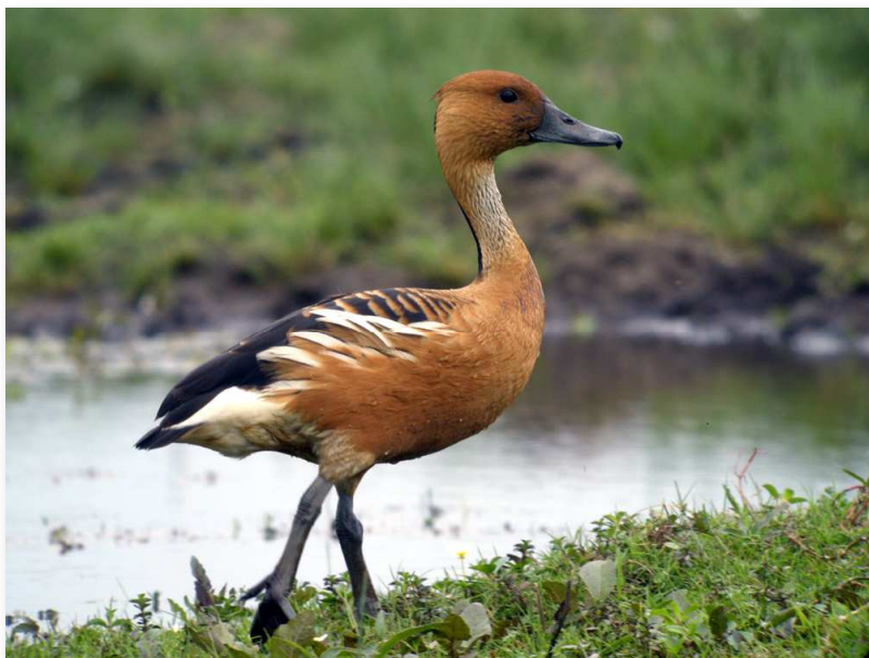
Dendrocygne fauve - Grand-Lieu