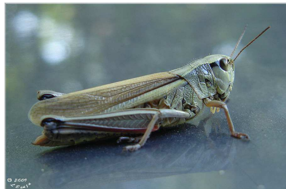
Criquet ensanglanté (L. Bauza)