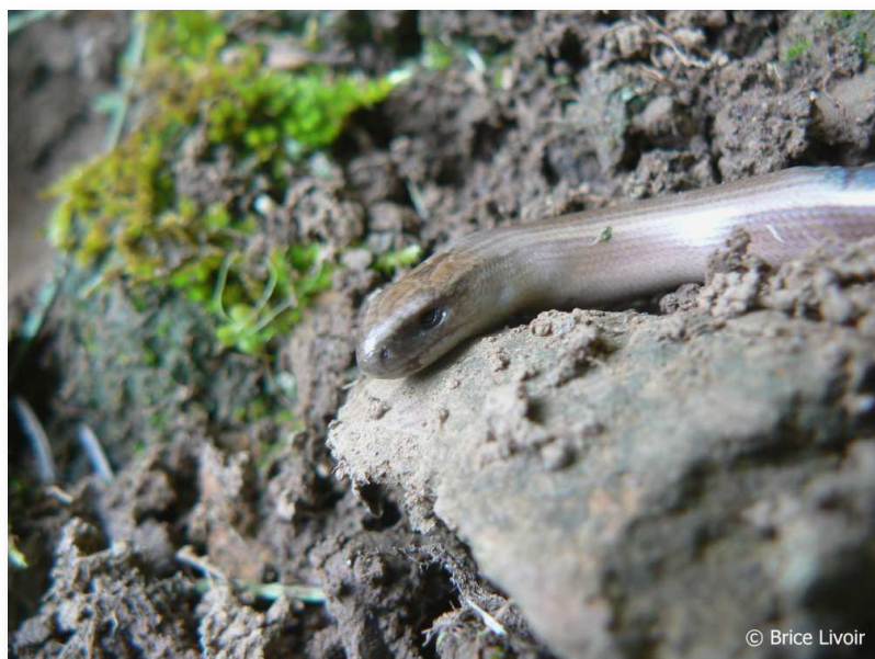
Orvet (B. Livoir)