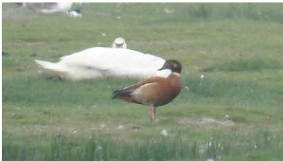
Hybride Tadorne de Belon x Tadorne casarca - Brière (J.-L. Dourin)