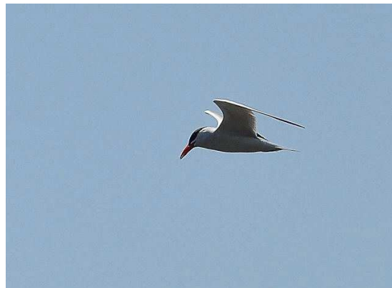
Sterne caspienne - Grand-Lieu