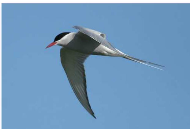
Sterne arctique - Traits de Mesquer (W. Raitière)