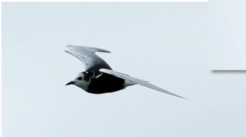
Guifette leucoptère adulte - Brière (J.-L. Dourin)