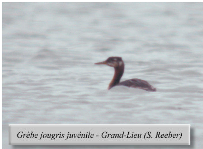
Grèbe jougris juvénile - Grand-Lieu

Peu de canards et oies particuliers, bien sûr, mais notons pour mémoire quelques échappés/introduits comme cette Bernache à crinière le 28/08 à Saint-Roch (DM), 6 Oies à têtes barrées le 21/08 à Donges (JF), 2 Ouettes d'Egypte toujours présentes en Brière le 9/07 (JLD, AT, DM), 1 couple d' Erismatures rousses le 13/08 à Beaumont (WR) et 1 couple de Canards carolins tout au long de la période à Grand-Lieu (SR). A noter aussi quelques données de nidification intéressantes, comme la première reproduction confirmée du Canard souchet dans le marais de Goulaine, avec 1 poussin non volant le 4/07 (FC), 4 nichées (3, 3, 3 et 7 poussins) de Fuligule morillon sur Beaumont (JM, WR), où 1 couple de Fuligule milouin a également niché cette année, avec 2 poussins contactés le 5/08 (JM). Nouvelle nidification, sur Goulaine toujours, du Grèbe à cou noir , avec 1 jeune émancipé le 4/07 (FC), alors que l'espèce ne semble pas avoir niché cette année à Grand-Lieu. Sur ce site, en revanche, l'observation d'un adulte et d'un juvénile de Grèbe jougris* le 6/08 (SR), pourrait faire penser à une reproduction locale, comme est étonnante cette observation précoce d'un Fuligule nyroca* juvénile le 13/08 (SR).