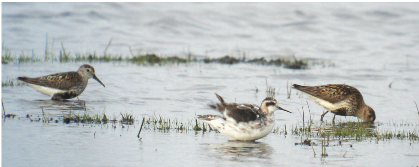
Phalarope à bec étroit adulte - Brière (J.-L. Dourin)

Le printemps dernier aura vu un véritable scoop en Brière, permis entre autre par des conditions hydrauliques favorables, avec les premiers cas français de nidification de la Guifette leucoptère , avec un nid avec 3 oeufs puis un autre avec un poussin observés en juillet (JLD, AT, DM & al.) ! Une note complète sur le sujet sera publiée dans la chronique à venir. Plusieurs observations de Guifette leucoptère * sont à citer en marge de ce phénomène, le dernier adulte briéron ayant été vu le 3/08 (JLD), alors qu'à Grand-Lieu, il y a eu 1 ad. le 17/07, 2 ad. le 31/07 et 1 ad. du 23 au 26/08 (SR), sans doute en provenance de Brière, au moins pour les plus précoces... Autre observation extraordinaire pour la Loire-Atlantique, 1 Martinet à ventre blanc a été vu le 2/08 à Sissable (YT, JPTr), fournissant la première mention départementale de l'espèce, alors que les derniers Martinets noirs sont normalement vus vers la mi-août, la donnée la plus tardive étant celle d'un oiseau le 26/08 à Donges (JM). Alors que le Pipit rousseline * chanteur continuait son séjour à Lyarne jusqu'à la mi-juillet (JYF), 1 juvénile de cette espèce a été noté le 21/08 à Donges (JF) et un autre le 28/08 à l'étang du Pont-de-Fer, Assérac (AG). Etonnante donnée d'un Pipit maritime loin du littoral, à l'étang de Beaumont, le 16/08 (JM, WR) ! Enfin, toujours peu de Beccroisés des sapins , avec seulement une obs de 6 oiseaux le 15/08 à Saint-Herblain (MV).