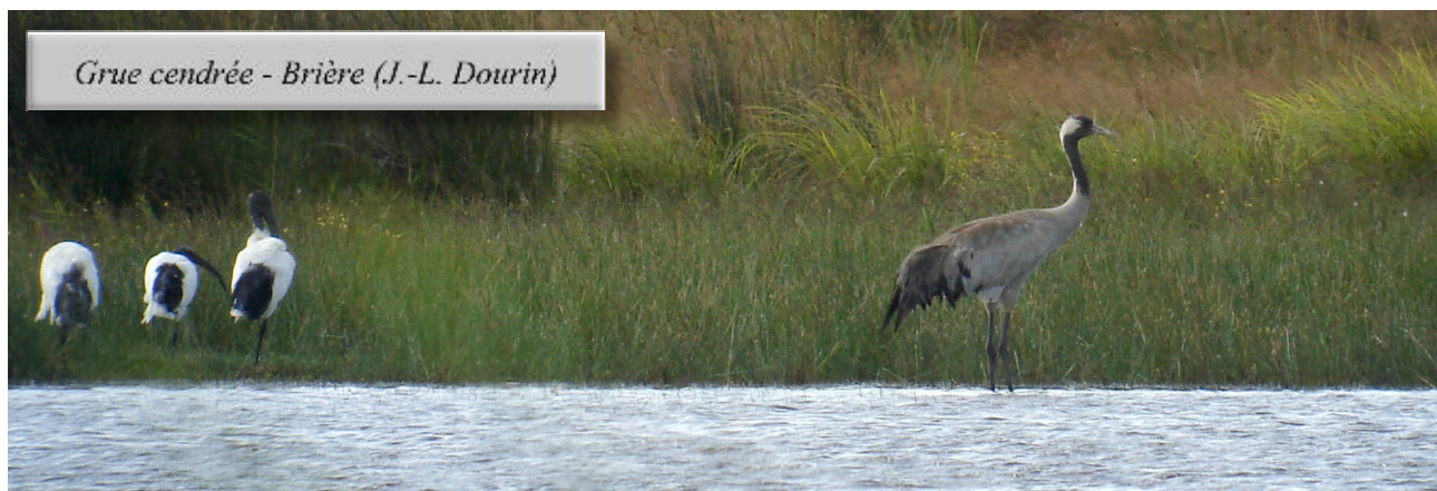
Grue cendrée - Brière (J.-L. Dourin)