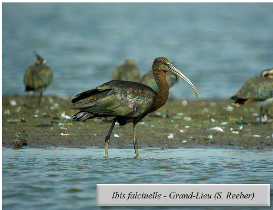
Ibis falcinelle - Grand-Lieu (S. Reeber)

Quelques rapaces avec les classiques Balbuzards pêcheurs : 1 le 29/07 à la Courbetière, Châteaubriant (SG), 1 le 7/08 à Saint-Dolay (JM), 1 les 6 et 8/08 au Massereau (FL), 1 le 28/08 à Donges (JF, JM) ou encore 4 le 29/08 au Massereau (FL). Moins nombreuses, deux données d' Autour des palombes en dehors des quelques sites traditionnels de nidification : 1 femelle le 23/08 au Massereau (FL) et une autre le 28/08 à Herbignac (DM). Plus étonnantes encore, trois données de Circaète Jean-le-Blanc* ont été obtenues à Donges les 27 et 28/08 (JF, JM) et à Guérande le 31/08 (JPT). Quelques rares observations de Marouette ponctuée , avec 1 oiseau refusant d'être bagué le 30/08 au Massereau (FL) et plusieurs contacts à partir du 20/07 sur un site briéron qui pourrait bien avoir vu nicher l'espèce (JLD, AT). Au même endroit, une Grue cendrée adulte a passé un séjour estival peu ordinaire, du 9 au 28/07, dans un paysage qui pourrait fort bien convenir à une future nidification... (JLD, AT, JJG, DM). Côté limicoles, toujours sur ce même secteur de Brière, 1 Glaréole à collier* a été observée de 13 au 27/07 (JLD, DM, AT), de même qu'un Phalarope à bec étroit* adulte du 20 au 22/07 (JLD, AT).