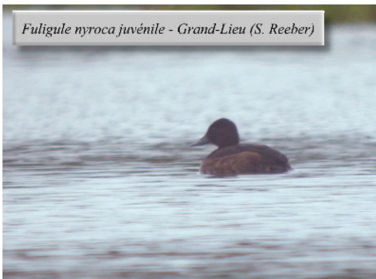
Fuligule nyroca juvénile - Grand-Lieu (S. Reeber)

Plusieurs sorties en mer ont apporté notamment des observations de Puffin des Baléares , avec au moins une centaine d'oiseaux le 28/08 au large de Dumet, accompagnés de 5 Puffins fuligineux* (JLD), ou encore 7 Océanites tempêtes entre la Turballe et Hoëdic (56) le 22/08 (JLD). Le Pélican blanc** de l'estuaire a été recontacté le 18/07 au moins (FL), alors qu'au Massereau, 1 Crabier chevelu a été observé le 20/08 (FN), deux autres observations de cette espèce ont été obtenues en-dehors de Grand-Lieu (5 nids trouvés cette année (SR)), à Varades le 3/08 avec 1 adulte (DD) et au Marais Audubon, Saint-Etienne-de-Montluc, du 9 au 25/08 (FR). Sur ce même site, jusqu'à 3 juv. de Héron pourpré ont été observés les 13 et 25/08, en plus d'un adulte le 17/08 (FR). Plusieurs données intéressantes d' Ibis falcinelle* ont été obtenues, avec les deux adultes de Brière contactés jusqu'au 30/7 (DM, JLD, AT, JJG), et 1 (différent ?) le 21/08 (JLD), 1 immature le 2/07