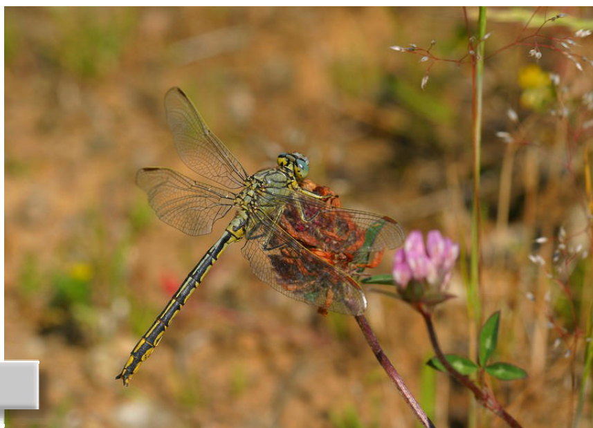
Gomphus pulchellus