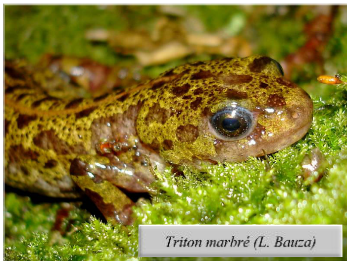
Triton marbré (L. Bauza)

Tritons marbrés , Salamandre et Crapaud commun sont signalés en forêt de Touffou le 10/07 (LB) où ces espèces sont bien connues. Le 26/08, Grenouilles agiles , Rainettes vertes et Crapaud commun y sont notés (PT). Enfin, l' Alyte accoucheur est contacté près de l'église de Boussay le 11/08 avec 3 à 4 individus (JYC).