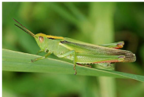
Paracinema tricolor (ci-dessus) le 30/07 à Grand-Lieu, Mecostethus parapleurus (à gauche) le 27/07 à Anetz (P. Trécul)