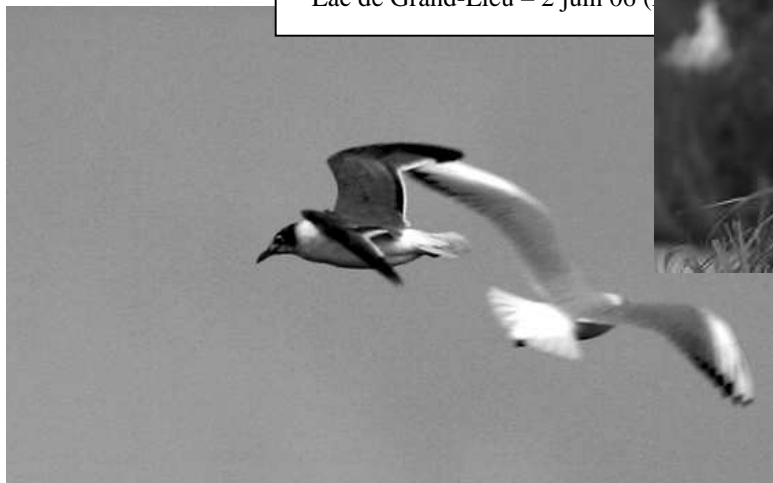
Mouette de Franklin Lac de Grand-Lieu – 2 juin 06