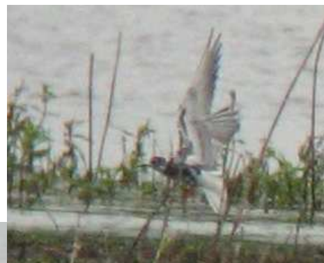
Guifette leucoptère Oiseau en plumage immature Erdre – Mai 2006