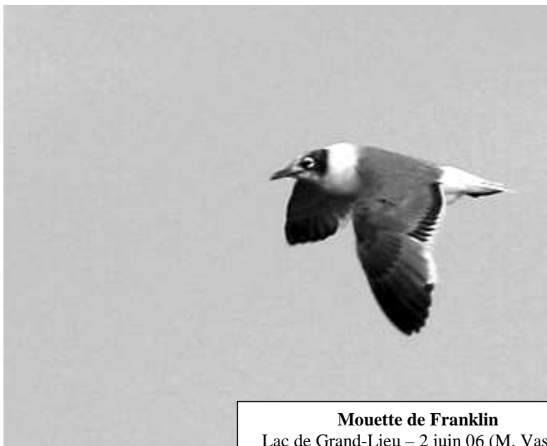
Mouette de Franklin Lac de Grand-Lieu – 2 juin 06

sont succédés sur le même site en mai, de même que quelques Tournepierrres à collier et un Bécasseau cocorli . Un autre cocorli a été vu en Brière le 20/05. Plutôt hors-saison, une observation de Courlis cendré le 13/06 au Grand Port et quatre le 2/07 en Brière.