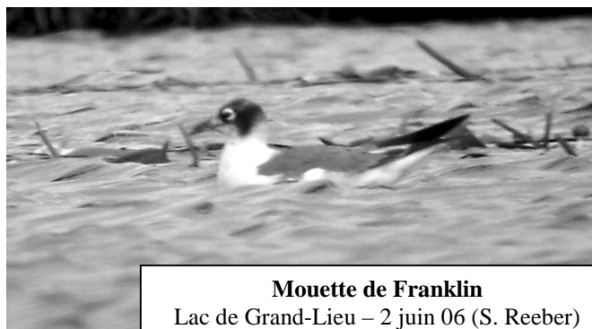
Mouette de Franklin Lac de Grand-Lieu – 2 juin 06